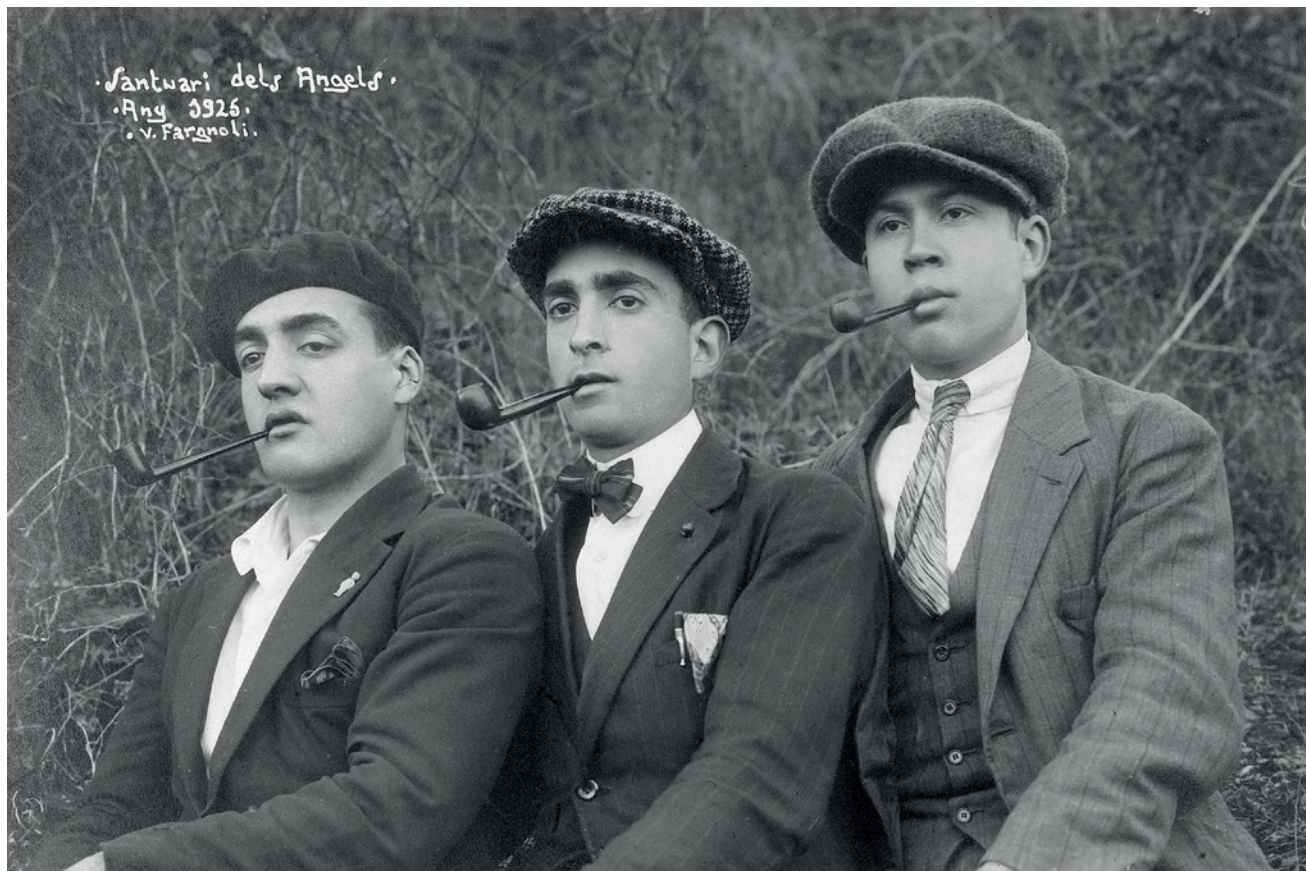
Ajuntament de Girona. CRDI (Valentí Fargnoli)

>> Membres de la secció dramàtica de la Societat Obrera l'Amistat camí del santuari dels Àngels, 1925. Exemple de retrat directe, frontal i nítid.