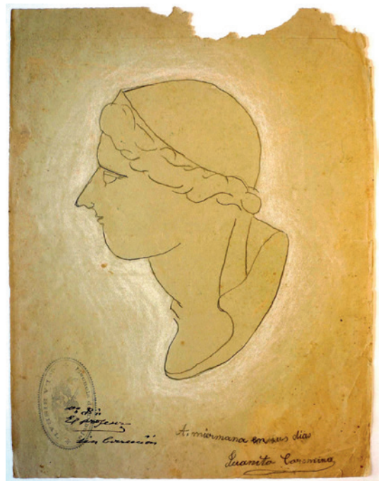
Fundació Rafael Masó