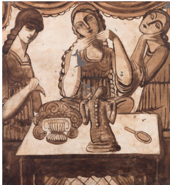
Museu d'Història de Girona, núm. reg. 01976