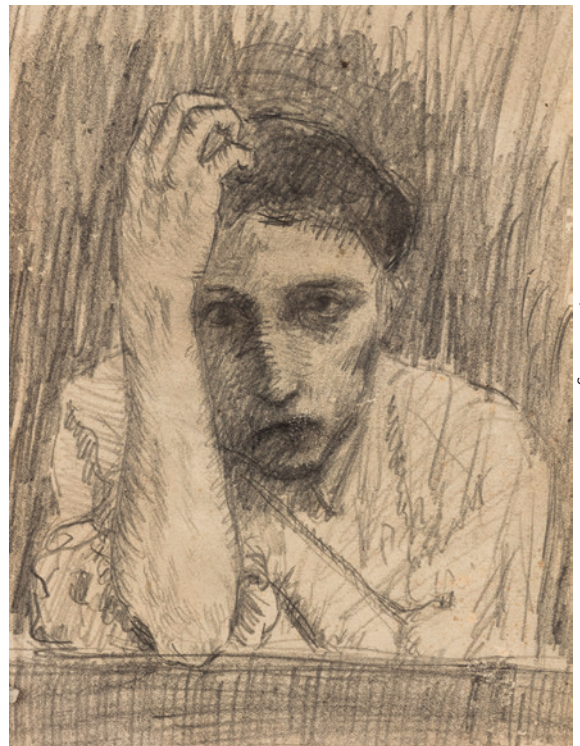
Museu d'Història de Girona, núm. reg. 01969