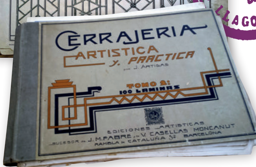
>> Portades dels llibres editats sobre les escoles de formació artística de les comarques de Girona.