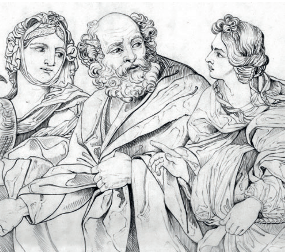
COL·LECCIÓ SABAT, ARGENTINA. CÒPIA HOMÒNIMA DE GUIDO RENI