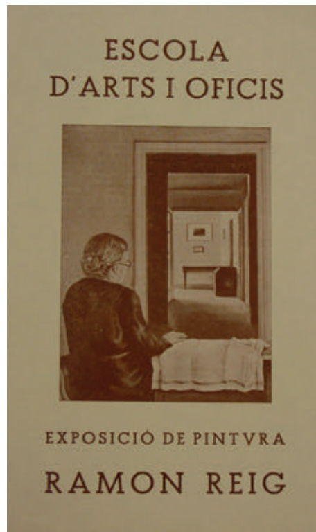
BIBLIOTECA FAGES DE CLIMENT, FIGUERES