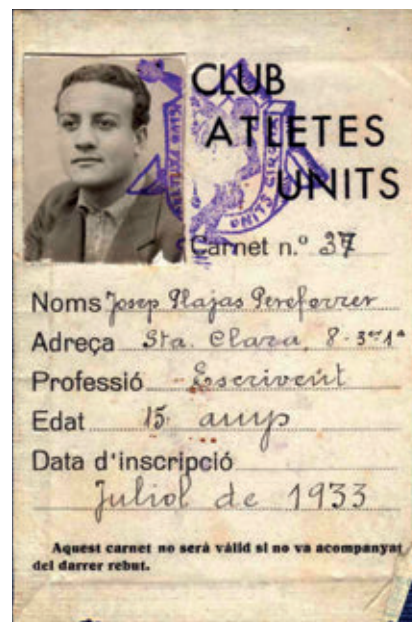
>> Carnet de Josep Plaja del Club Atletes Units (1933).

Destacà la seva activitat al Club Atletes Units, al GEiEG i al Club de Natació Girona