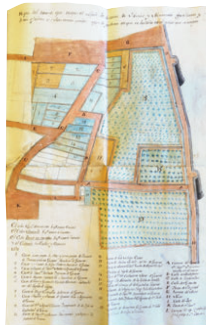
ARXIU GENERAL DE LA DIPUTACIÓ DE GIRONA

A les seves darreres voluntats, Ignasi de Colomer i de Cruïlles, prohom gironí d'elevada nissaga, traspasat el 14 de setembre de 1763, instituïa el començament de la Casa de Misericòrdia de Girona