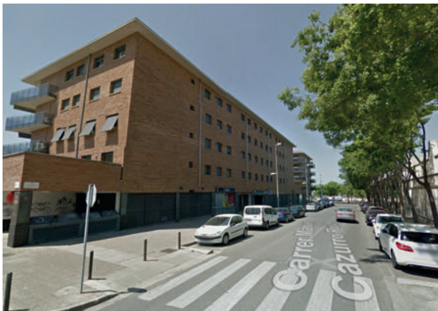
>> Carrer de Manuel Cazurro, Girona.