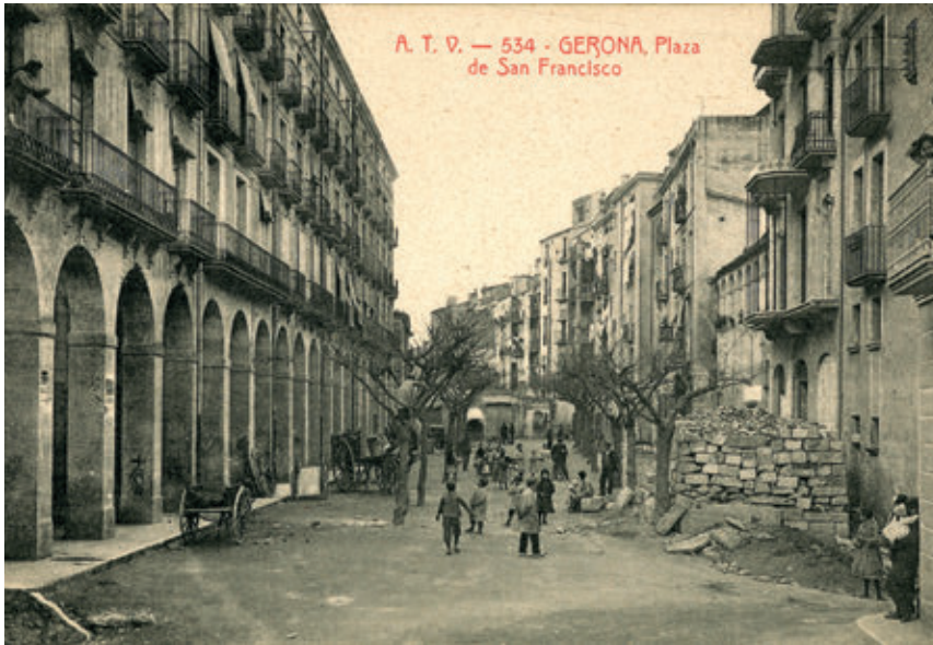
>> Vista parcial de la plaça del Gra, posteriorment avinguda de Sant Francesc, 1905-1911. A la dreta, la Encomienda de Isabel la Católica.

gi professional i un notable reconeixement social. No tenia cap ganes de deixar la ciutat, però a mitjan 1859 va rebre una oferta de treball del marquès de Salamanca i comte de los Llanos que no va poder rebutjar.