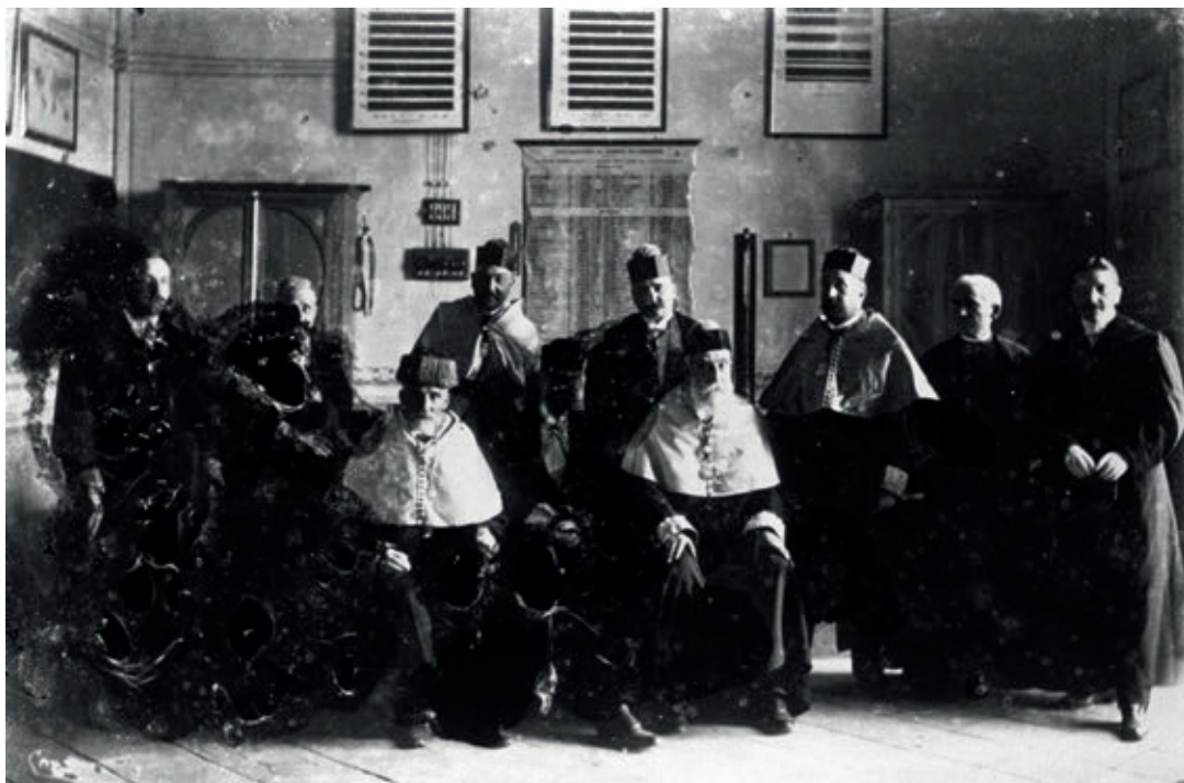
AJUNTAMENT DE GIRONA. CRDI FONS CARLES RAHOLA LLORENS. SÈRIE - CORRESPONDÈNCIA REBUODA