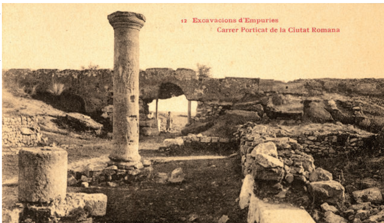
12 Excavacions d'Empúries Carrer Porticat de la Ciutat Romana

cies i reunint una important col·lecció d'insectes, que més endavant donaria al Museu de Ciències de Madrid.