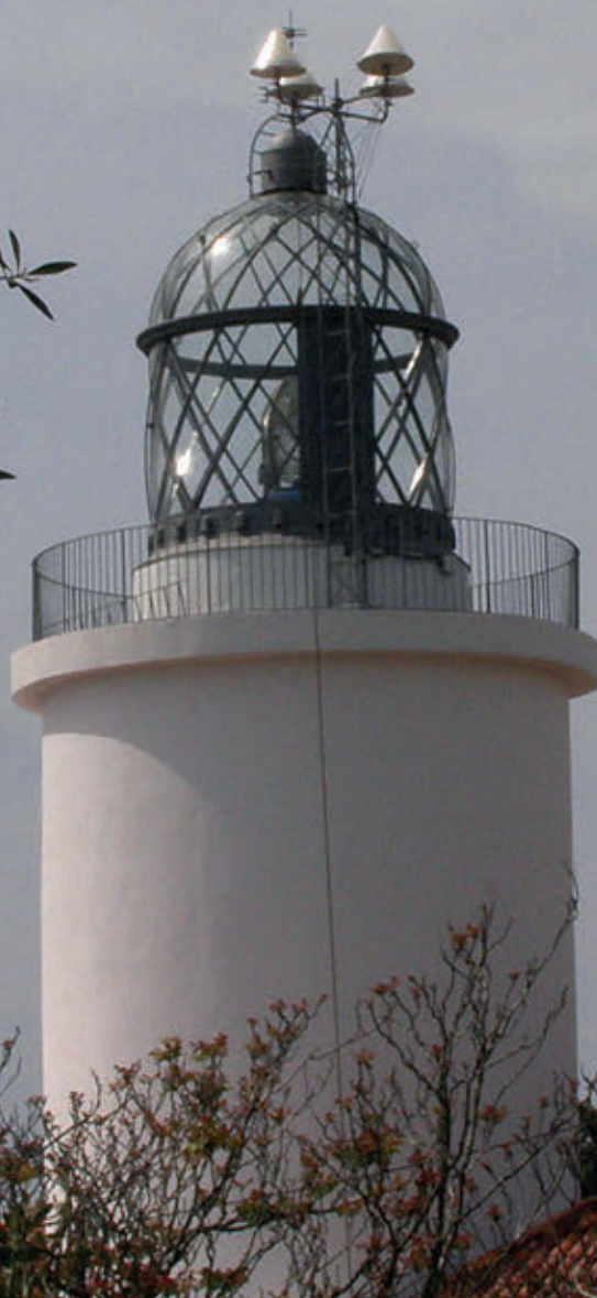
<< El far de Sant Sebastià a Palafrugell. Inaugurat l'1 d'octubre del 1857.