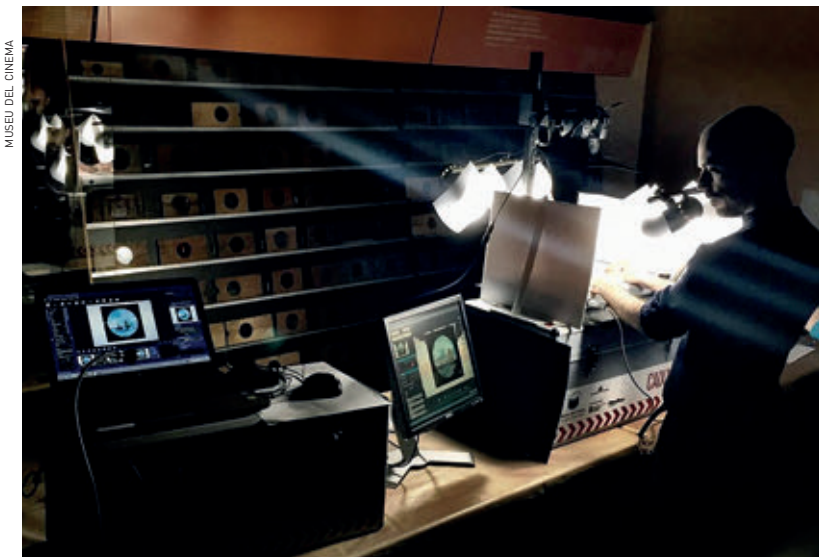
MUSEU DEL CINEMA

>> Catalogació de plaques de llanterna màgica al Museu del Cinema (Girona).