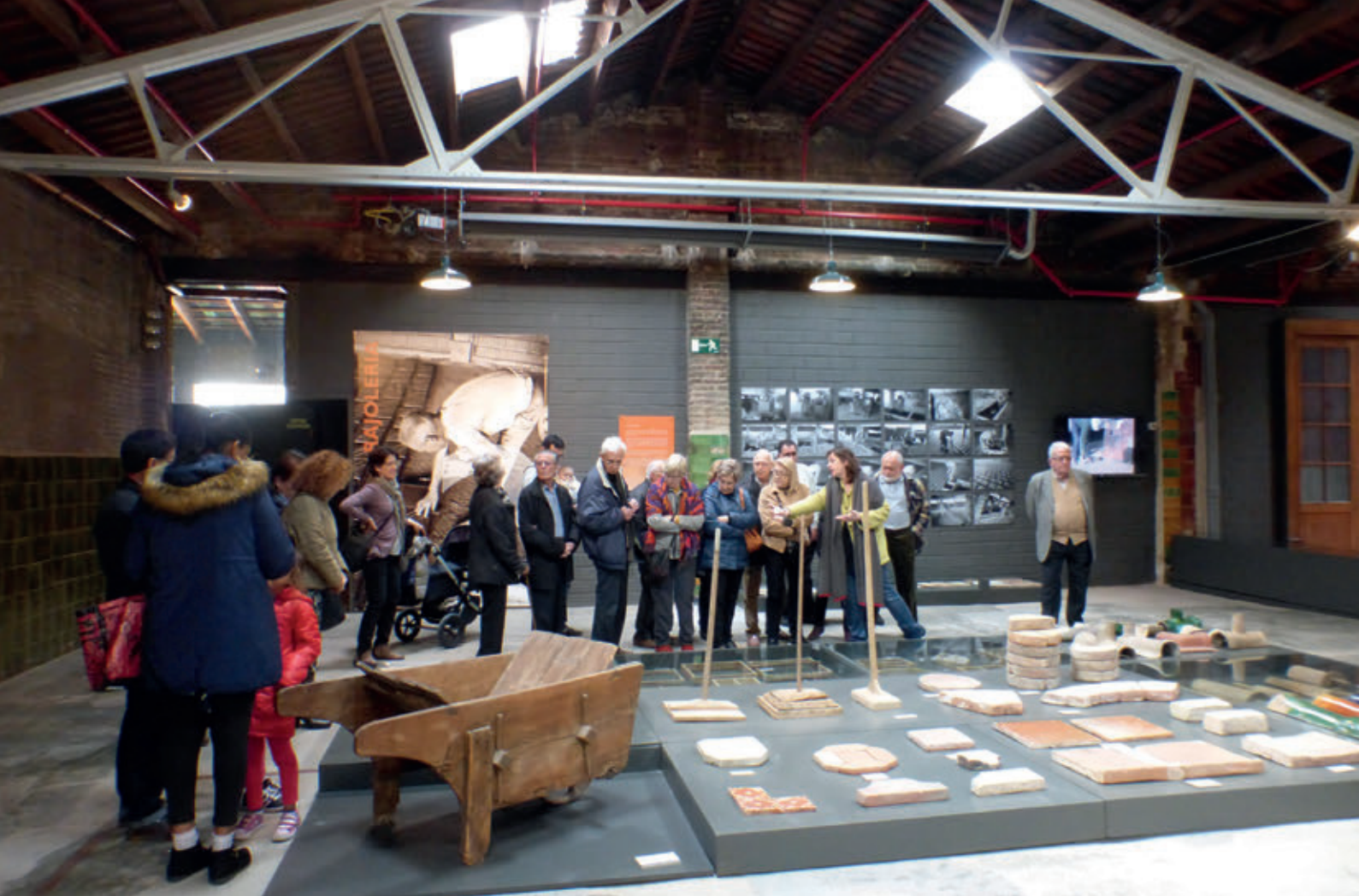
EL TERRACOTTA MUSEU DE LA BISBAL D'EMPORDÀ