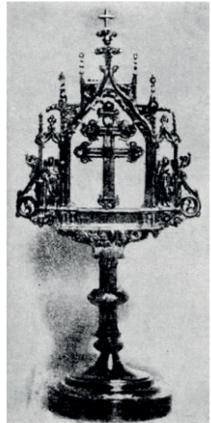
>> Imatge del reliquiari robat.

A inicis del segle xi el comtat de Besalú estava en auge, però a diferència d'altres comtats no disposava de bisbat propi