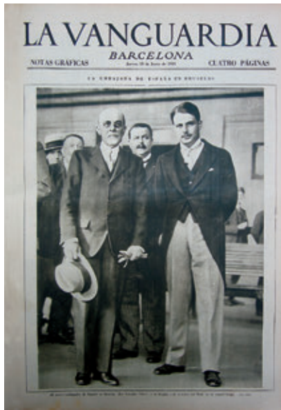
>> Salvador Albert, tot just arribat a l'estació del Midi en la seva destinació com a ambaixador de la República espanyola, és rebut per un representant del Govern belga, el 15 de juny de 1931, i és portada de les «Notas gráficas» de La Vanguardia (18 de juny de 1931).