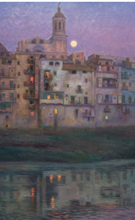
COL·LECCIÓ DEL MUSEU D'ART DE GIRONA. FOTO PEP CABALLE