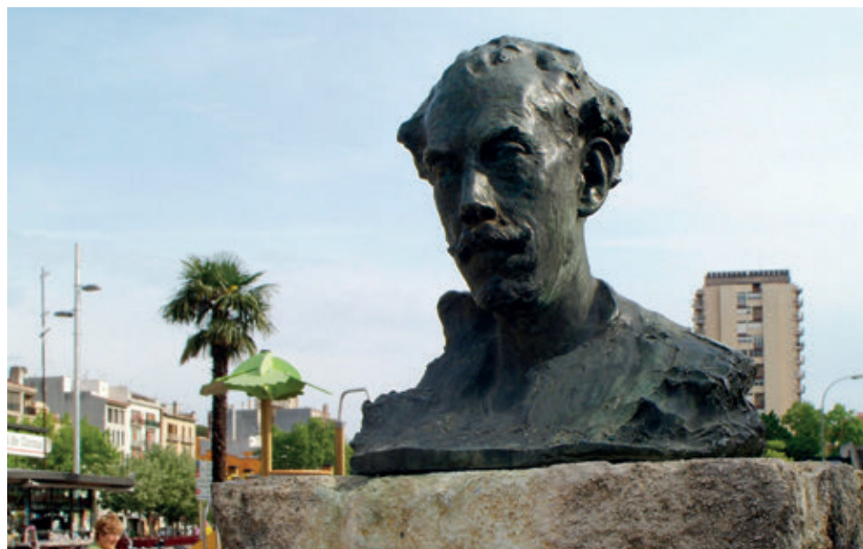
>> Bust en homenatge a Prudenci Bertrana, obra de Ricard Guinó situada a la plaça Catalunya de Girona.

pedir-me de vosaltres» (discurs reproduït a El poble català el 3-10-1912). A partir d'aquest moment s'aferrarà literàriament a aquesta senzillesa i rusticitat com a trets identitaris en l'agitada selva urbana.