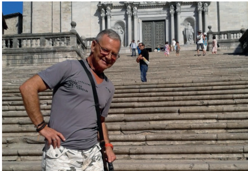
>> Visitant Girona, a les escales de la Catedral, després del retorn, cap al 2012.