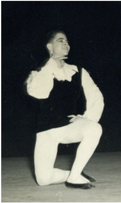
>> Actuant al Teatre Municipal de Girona el 12 de juny de 1960.