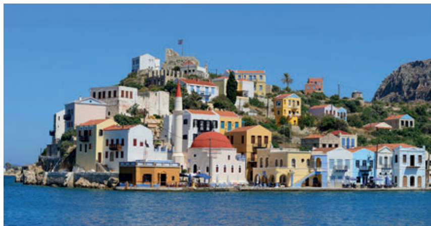
>> La fortalesa protegia l'entrada de les naus a port.

Tractant-se d'un territori insular de gran valor estratègic, que constituïa l'enclavament més oriental de la