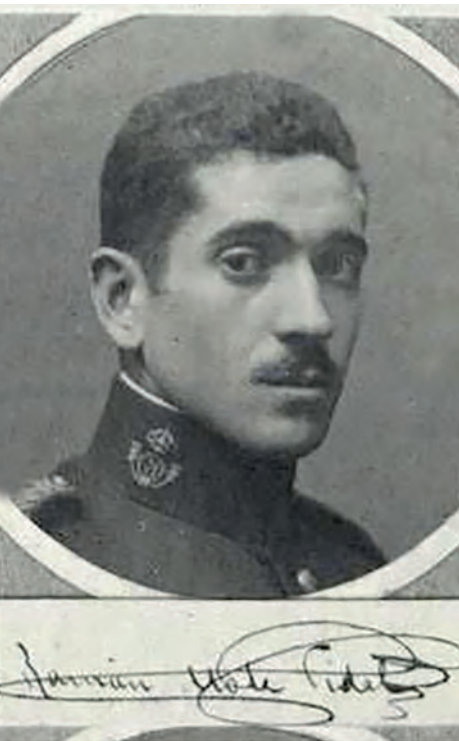
>> Ramon Mola Vidal. (Cuba, 1896 - Barcelona, 1936).