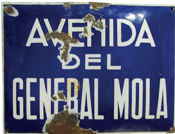
>> Placa d'una avinguda dedicada a Emilio Mola, germà de Ramon Mola.

vacilantes que aquel que no está con nosotros está contra nosotros, y que como enemigo será tratado. Para los compañeros que no son compañeros, el movimiento será inexorable».