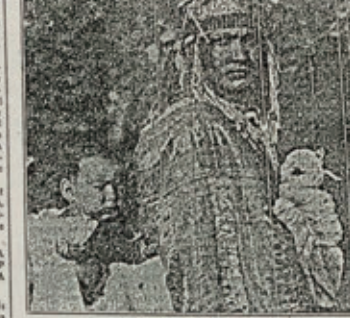
Dona musulmana marroquina