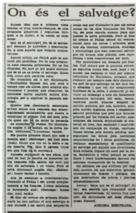
>> «On és el salvatge?», article de l'autora publicat a L'Opinió el 13 d'agost del 1931.

A partir de la segona meitat dels anys vint, i sempre amb la perspectiva d'una dona moderna, Bertrana publica en diversos diaris, setmanaris i revistes ( D'Ací i d'Allà , Evolució , Bondat-Bonté , Claror , Mirador , La Rambla , La Nau , La Veu de Catalunya , etc.) tant versions i relats complementaris de molts dels textos que integren Paradisos oceànics (1930) i El Mar-