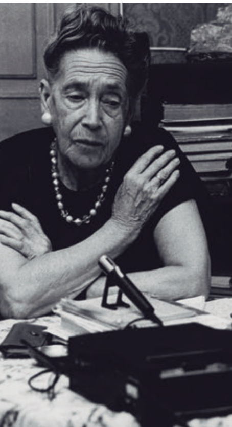
AJUNTAMENT DE GIRONA. CRDI (FONS EL PUNT - BARCELÓ)