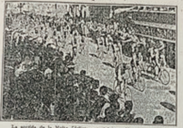
La sortida de la Volta Ciclista a Catalunya.