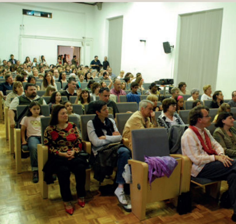
<< Acte de lliurament de premis del Concurs artístic i literari.