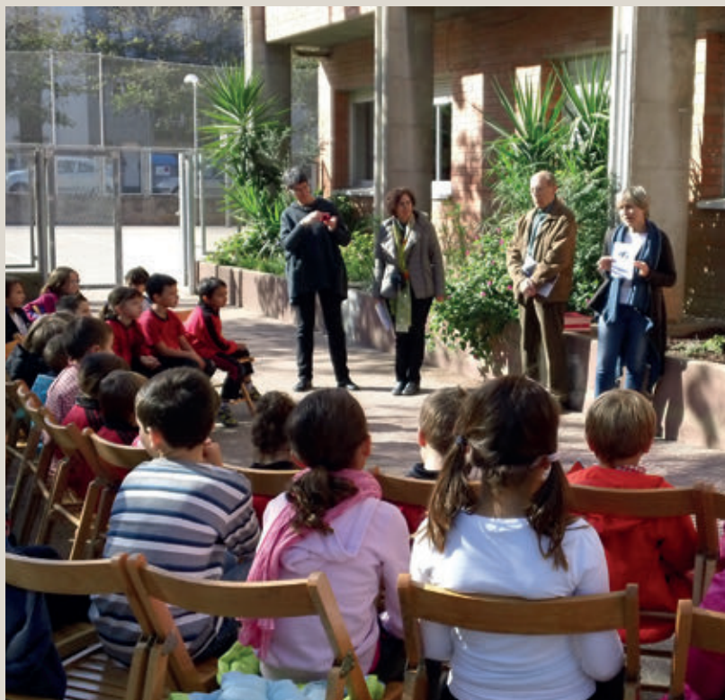
<< Apadrinem escultures a l'escola Migdia de Girona.

(21 de febrer), el Dia mundial de la poesia (21 de març), el Dia europeu de les llengües (26 de setembre) i el Dia del patrimoni audiovisual (27 d'octubre). També participen en els projectes de sensibilització cultural a través d'accions que han esdevingut molt populars, com ara la vetllada literària «Nit de Poetes»; els cicles de patrimoni industrial; el projecte «Apadrinem escultures»... Tot plegat complementat amb una constant producció d'audiovisuals per posar en valor la història i el patrimoni de les comarques gironines. Sense oblidar el concurs artístic i literari que s'organitza des del 1994 i que ha esdevingut un dels esdeveniments més emblemàtics.