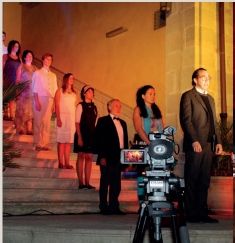
<< Nit de Poetes 2013. Homenatge a Salvador Espriu.