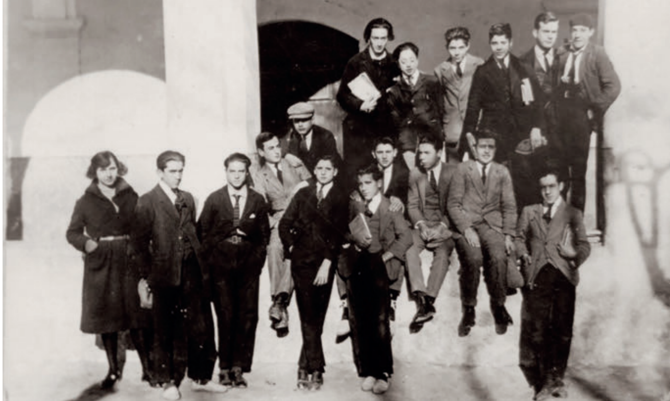
OBRES D'INATGE DE SALVADOR DALÍ RESERVATS. FUNDACIÓ GAL·LA-SALVADOR DALÍ, FIGUERES, 2016

vant. En el cas dalinià l'anacronisme és curiós perquè, de fet, es concep la seva pintura com una gran revolució quan, en origen, Dalí partí d'una disciplina i conservadorisme pictòric que, més que al trencament, tendien a la reacció.