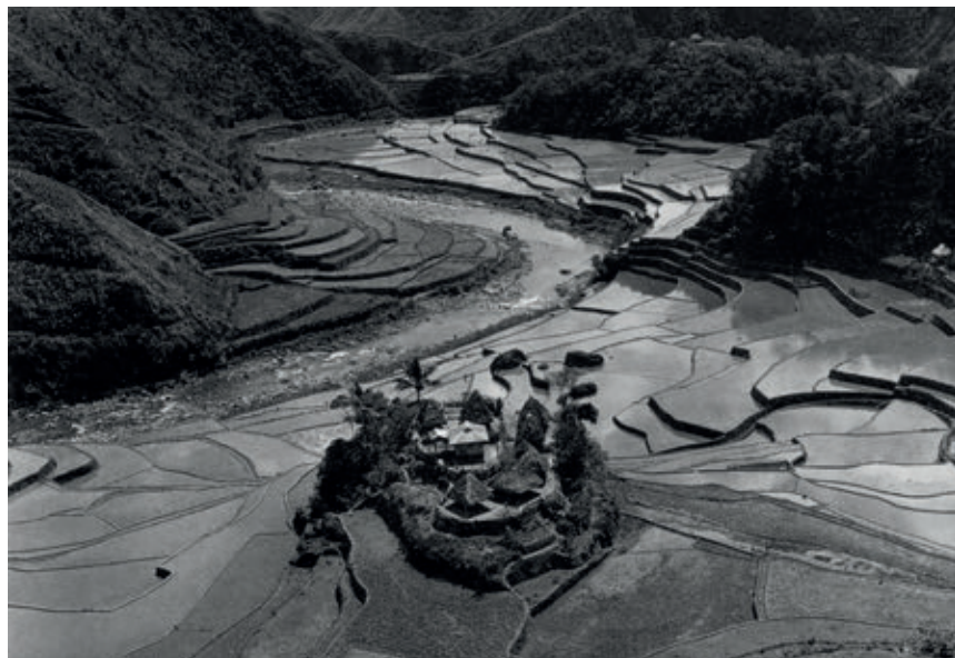
NORD DE L'ILLA DE LUZON