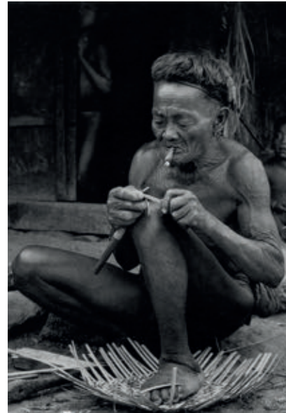
<< A l'esquerra, noia amb la pipa, 1954. Al mig, un líder de Bilig, 1950. A la dreta, fent una cistella de bambú, 1950.

ciència infinita. Aquestes virtuts, combinades amb una gran intuïció, un agut sentit de l'observació i una curiositat sense límits, li varen permetre, ara que tenia més recursos i un estudi en condicions, completar tota la gran feina de documentació dels pobles de La Cordillera que havia iniciat abans de la guerra.