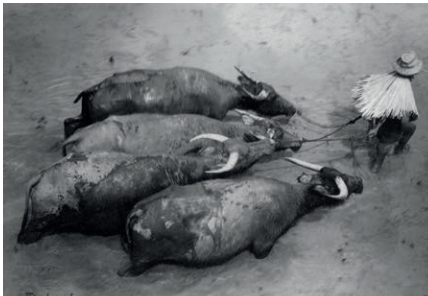
<< Treballant la terra a Lubuagan, Kalinga, 1948.

A començament dels anys quaranta torna a Sagada i inicia, d'una forma sistemàtica, la documentació de diferents grups ètnics que habiten al nord de Luzon. La tasca no és fàcil, atès que, d'entrada, algunes comunitats indígenes el veuen com un intrús que vol robar-los les seves ànimes. A