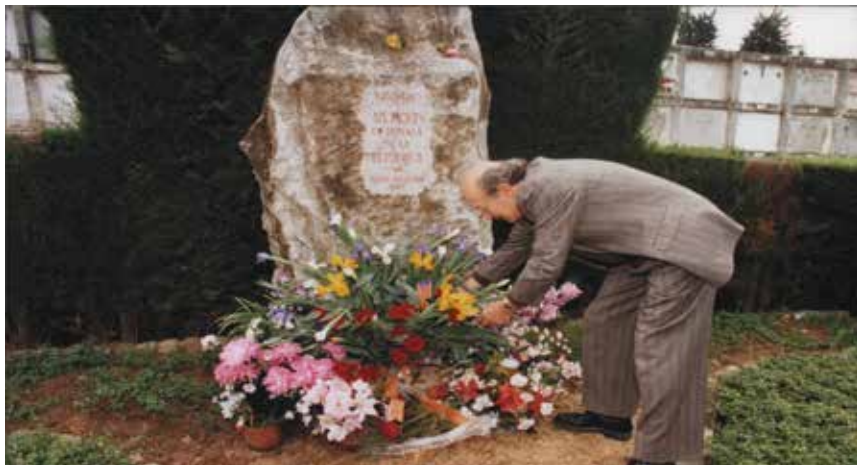
<< Ofrena floral als republicans afusellats durant la Guerra Civil al cementiri de Girona, 1994.