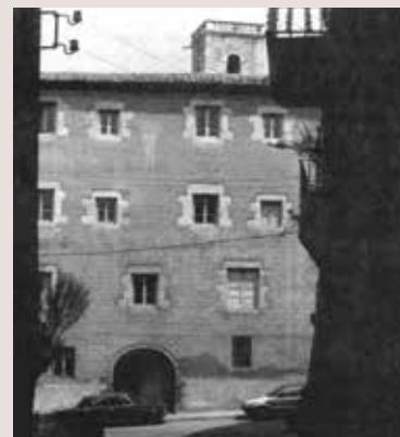
<< Entrada de la que va ser la presó al Seminari de Girona.

Fins ara hem trobat dades de 601 gironins afusellats en diferents llocs de Catalunya i 36 a Lleó