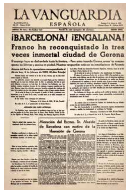
<< La Vanguardia Española del 5 de febrer de 1939.

Després de la promulgació de la Llei de responsabilitats polítiques, milers de ciutadans van córrer a denunciar veïns, amics, familiars i fins i tot desconeguts