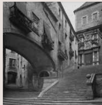
AJUNTAMENT DE GIRONA. CROU [FOTOGRAFIA UNAL]

<< Escales que baixaven els presos per anar al cementiri de Girona a ser afusellats.