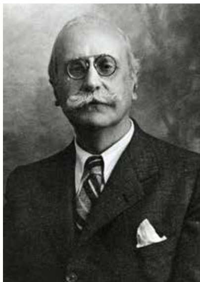
AJUNTAMENT DE GIRONA. CROCI (AUTOR DESCONEGUT)