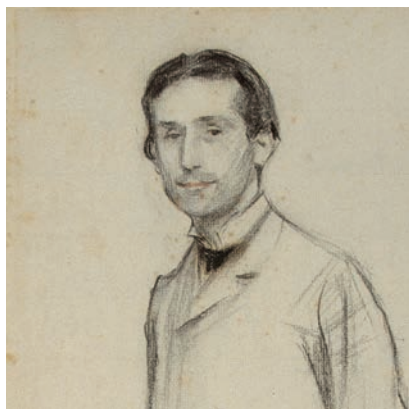
>> Pompeu Fabra.