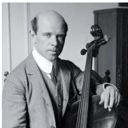
>> Pau Casals.