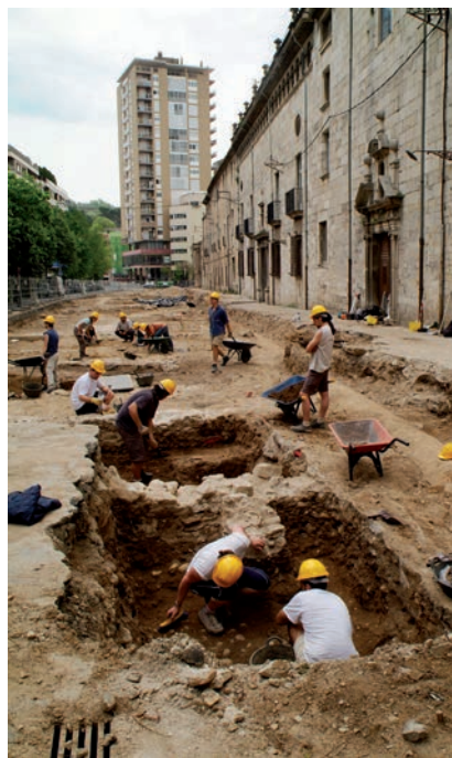
AJUNTAMENT DE GIRONA. CROU LLORENS CARRERA