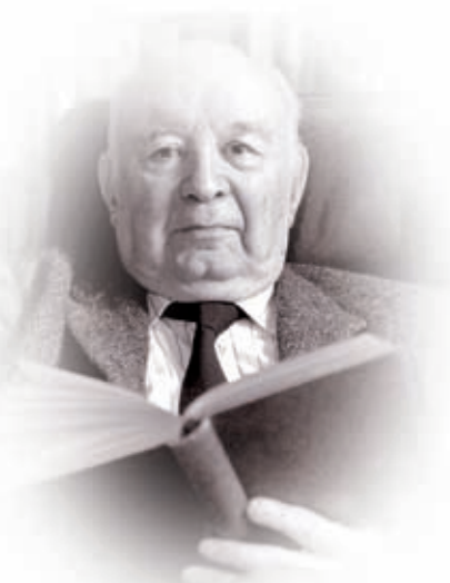
>> Martí de Riquer.