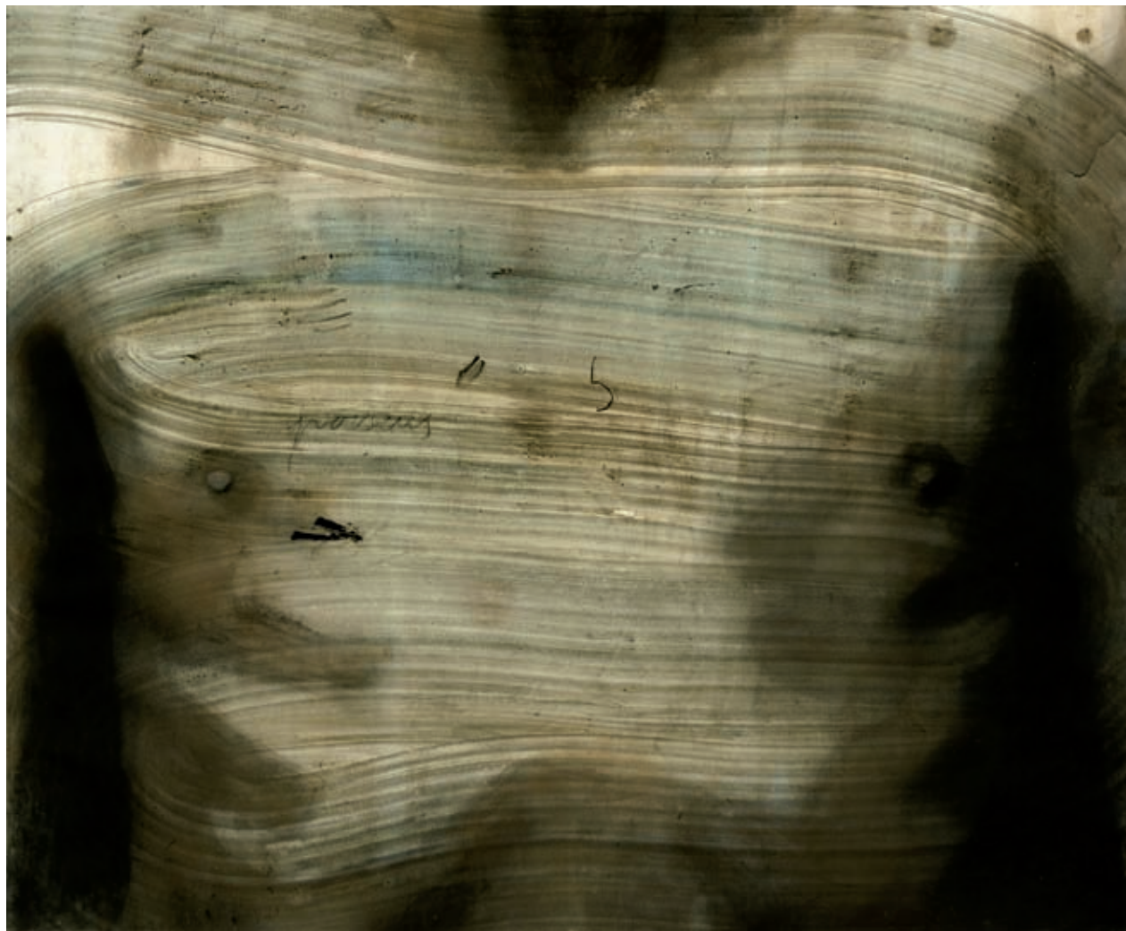
2015, tècnica mixta sobre fusta, 108 x 133 cm.

tenim la certesa que, en primer lloc, són treballs ben fets i ben acabats, i que l'atzar i el pensament s'han conjurat per cloure una obra; i que l'artista, el mèdium, les ha treballat i les ha conformat amb tota mena de saboroses eines formals, sigui en les capes de pintures, sigui en les proporcions mil·limètriques dels cossos, sigui quan els cossos s'entollen en la tenebra del misteri o quan delimiten les formes del dolor o en la voluntat d'apropar-nos a les ingents i infinites facetes que el cosmos proporciona i que ignorem però que l'artista sí enuncia. L'obra iserniana explora les possibilitats expressives i, com que neix del fet que la veritat és bella, és clar, fan referència —com diu Isern— a l'home com a portadors d'idees i, també, de