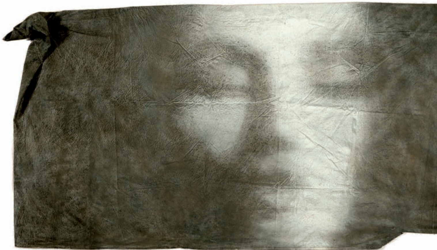
2015, tècnica mixta sobre llençol, 75 x 177 cm.

L a meticulositat i el perfeccionisme de les seves obres poden ser les seves primeres cartes de presentació, i també la seva contundència expressiva i l'aiguabarreig formal en què el realisme corporal accepta potentíssims gestos provocadors o potser rabiüts, o sibil·lines constàncies dels pòsits que la vida i la introspecció, mai finida, en l'esperit desperten les seves obres. En Jordi Isern (Barcelona, 1962) emet una veu reposada però segura, atraient, sense deixes sonores, justa però valenta, aco-