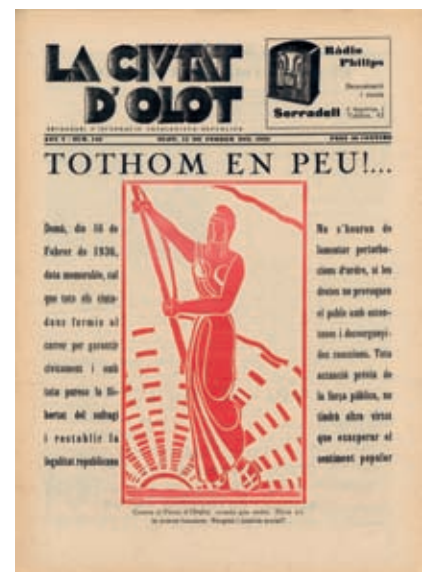
<< Una portada de la revista Ciutat d'Olot, òrgan d'Acció Catalana Republicana.

El republicanisme contemplava l'art des d'una òptica idealitzant, com un objecte de gaudi estètic i un mitjà d'emancipació