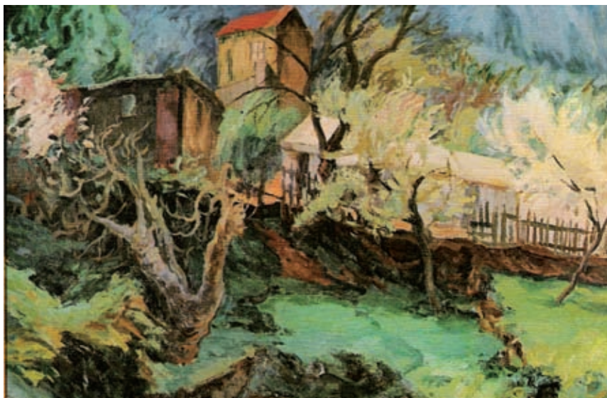
MUSEU MUNICIPAL DE TOSSA