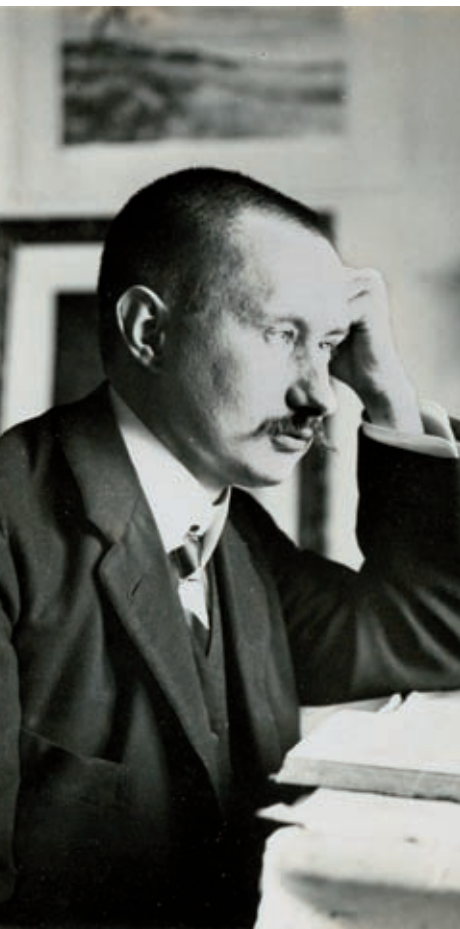
AGOSTA, SENNEI D'IMATGES, FONDS FAMILIA GARGANTA.