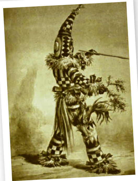
>> El ñáñigo, segons un dibuix de Víctor Patricio de Landaluze que il·lustrava un article d'Enrique Fernández Carrillo per al llibre Tipos y costumbres de la isla de Cuba. (L'Havana, 1881).

Les guerres de Cuba varen provocar la persecució i criminalització de tots aquells susceptibles de ser insurrectes, i els englobaren tots, delinqüents i enemics, dins d'un mateix sac amb l'etiqueta ñáñigo