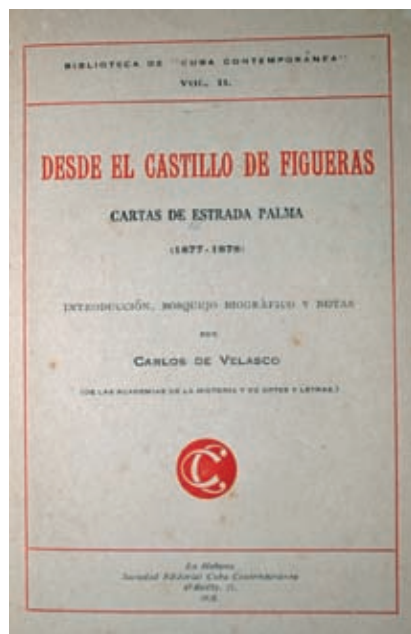
>> Desde el Castillo de Figueras – Cartas de Estrada Palma (1877-1878), llibre publicat a l’Havana el 1918.