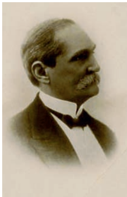
>> Tomás Estrada Palma (1835-1908), primer president de la República de Cuba (1902-1906).