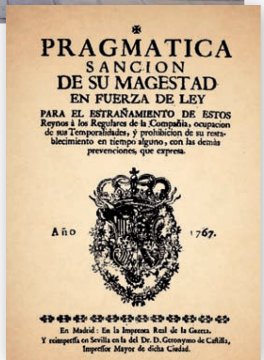
>> Decret d'expulsió dels jesuïtes, de 1767.

Foren detinguts i empresonats, acusats de dur documents que feien referència a una possible bastardia del rei espanyol, Carles III