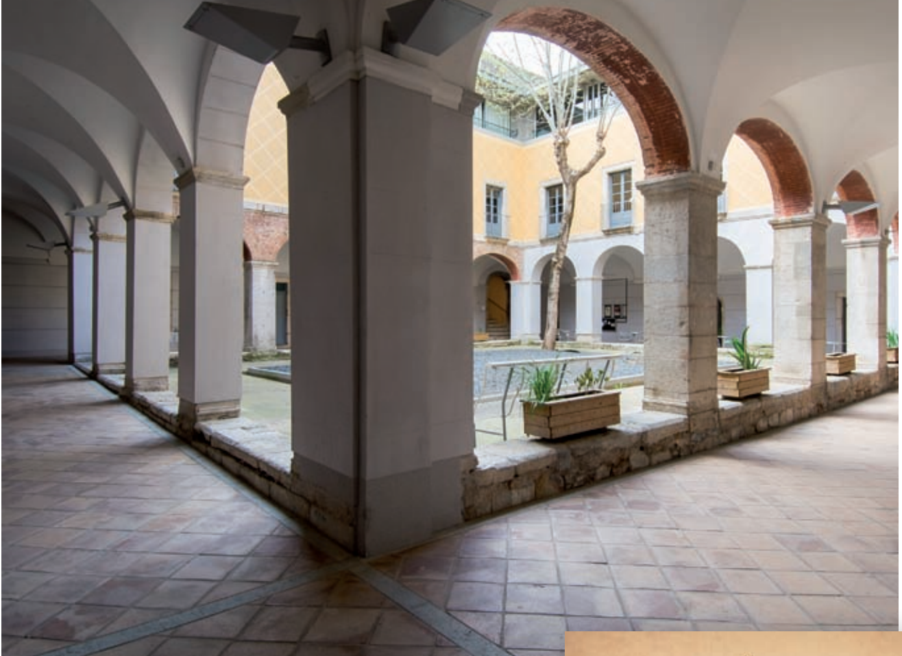
>> Claustre del convent de la Mercè, actualment.