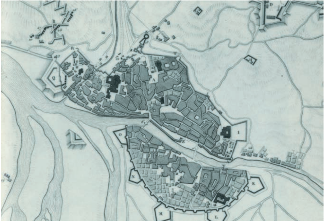
>> Plànol de Girona, 1809. A la dreta, escut reial del Col·legi de Sant Martí Sacosta.

BN PARIS. DEP. CARTES ET PLANS. GE. C. 9454