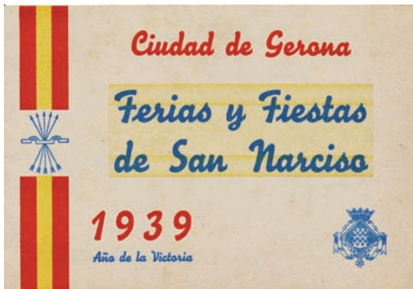
>> Portada del Programa Oficial de Festes de 1939.

Això condemnava la ciutat a prescindir durant molts anys de la data central de la seva Festa Major, i a introduir una estranya jornada de dol enmig de l'ambient festiu de les Fires. Afortunadament, va prevaldre el sentit comú: després de múltiples gestions, que van durar quasi un any, el Ministerio de Gobernación, amb data 14 d'octubre de 1940, va dictar un decret que, excepcionalment, concedia a Girona la facultat de traslladar el Día de los Caídos al