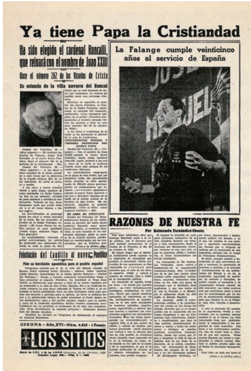
>> Primera pàgina del diari Los Sitios del 29 d'octubre de 1958.

Arribats al 29 d'octubre de 1958, vint-i-cinquè aniversari de la fundació de la Falange, els periodistes gironins es van trobar amb un conflicte d'interessos que havia d'acabar en una grotesca col·lisió. El dia abans a la tarda, mentre les campanes dels temples gironins efectuaven el « Repique general » que anunciava l'inici oficial de les Fires, els cardenals de l'Església catòlica reunits a Roma elegien el successor de Pius XII, el papa —i avui sant— Joan XXIII. La notícia, com era obvi, havia de sortir destacadament a la primera pàgina. El diari, però, no volia —o no podia— renunciar a la seva efemèride. La solució d'un dilema que per a ells devia ser tan greu va ser maquetar una portada amb una combinació maldestra, digna de passar a l'antologia dels pitjors disbarats periodístics. La capçalera del diari va quedar relegada al lloc més inhòspit: a baix de tot, a la part inferior esquerra. Pel que fa a la resta, la imatge que reproduïm val més que mil paraules. Podem dir només que el lector apresat que va consultar el diari aquell matí, en conjugar el titular de dalt de tot amb la gran fotografia col·locada sota seu, va poder creure, per un moment, que els purpurats de Roma havien elegit com a nou Pontífex José Antonio Primo de Rivera.