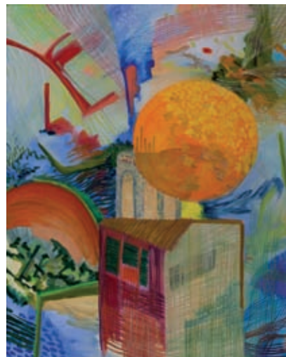
Renéixer fèrtil XIV (2009). Oli sobre tela. 81 x 130 cm.