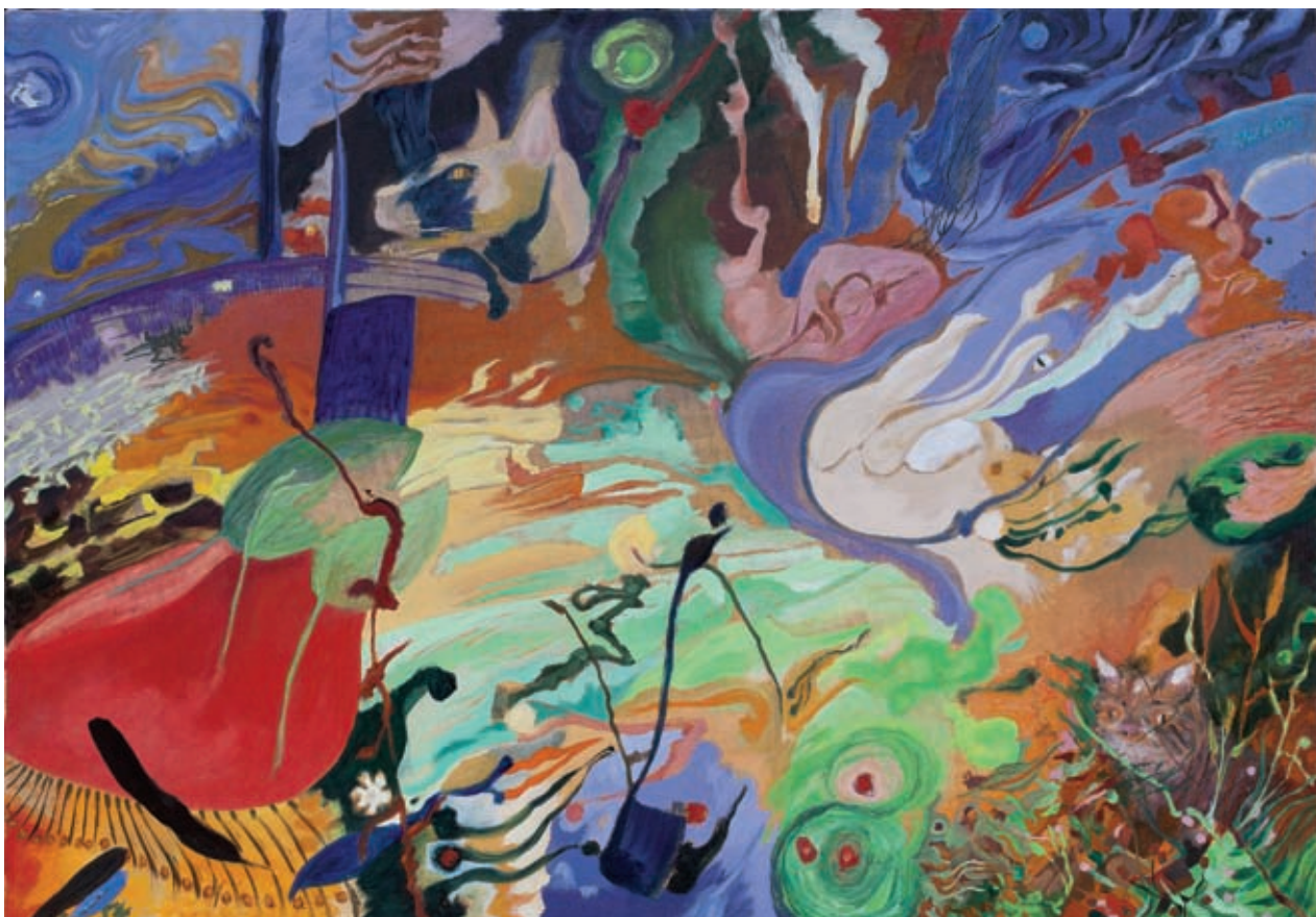
Renéixer fèrtil XIII (2009). Oli sobre tela. 89 x 130 cm.

experimentar nous materials i se'ls valoraven els avenços. No es donava cap tipus de titolet , en uns moment que tothom se'ls inventava encara que no tinguessin cap validesa. El que més es perseguia era la formació de l'alumne. Visitaven el taller intel·lectuals i artistes plàstics del moment, i l'Adrià, des del seu racó, amb els deures intactes sobre la taula, tenia les orelles parades cap a les converses. Són molts els artistes que esmenta, però té una especial admiració per Guinovart, que va ser un important puntal en uns moment decisius de la seva formació, ja que d'adolescent li va fer d'ajudant. Guinovart era tot força, un home inquiet que quan treballava podia tenir diferents quadres escampats per l'estudi, i fer una taca en un, una línia en un altre. L'Adrià va quedar extraordinàriament sorprès per aquest mètode de treball, ja que estava acostumat a veure la seva mare pintant