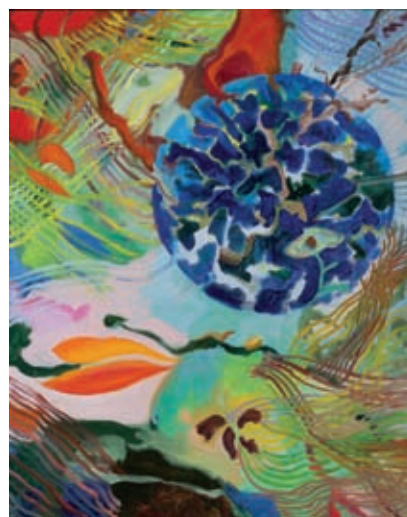
Xarxa que no tinc I (2015). Oli sobre tela. 92 x 73 cm.

En els seus quadres pot aparèixer més d'un horitzó, més d'una lluna, molts de sols, i les figures visionades com en plans futuristes. Ell, però, afirma que basa el seu llenguatge en la temàtica, l'estructura i el color, sense forçar cap unitat d'estil. Busca l'expressió del seu món interior, que és complex i a voltes contradictori. Diu que és com un trencadís, de manera que l'addició de cada part acaba per configurar un tot coherent.