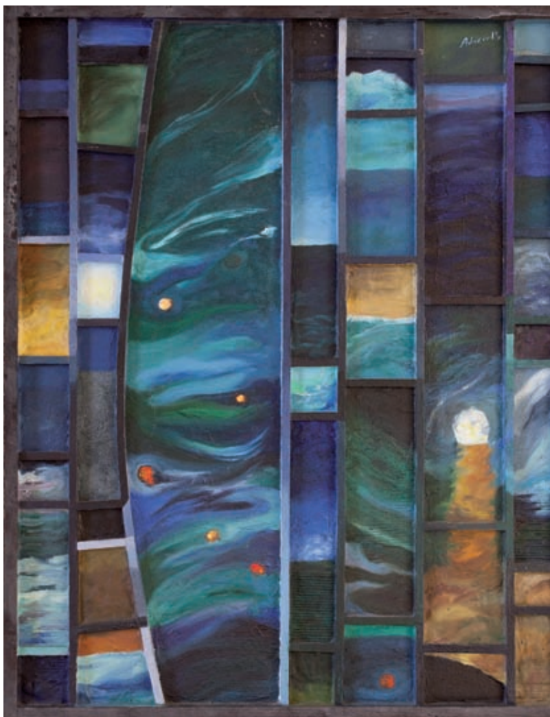
Mentre dormo sé de fragments de nit que em guarden la llum de la intriga (2002). Oli i tècniques mixtes sobre fusta. 80 x 65 cm.