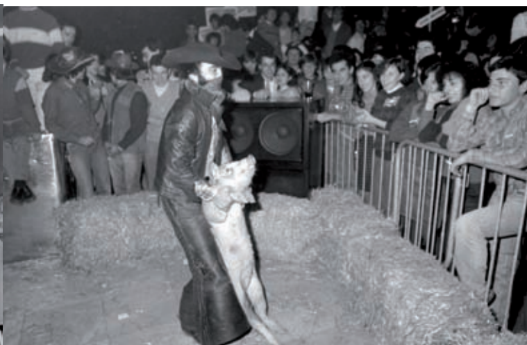
FONS DANI DUCH. INSPAI - DIPUTACIÓ DE GIRONA

El mateix local va acollir entre 1977 i 1985 el Chaplin's, regentat pels germans Baró, que programaven jazz en viu amb el músic Benet. L'edifici va ser enderrocat el 1991.