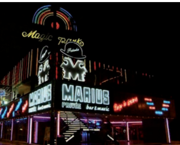
PLATJA D'ARO VIVA