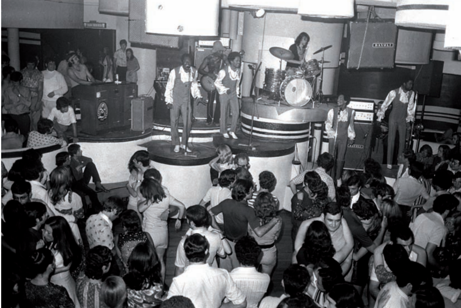
FONS PABLITO. INSPA I - DIPUTACIÓ DE GIRONA

amb barret bombí va aparèixer aviat en tot tipus de productes de merchandising- i també en la seva expansió nacional i internacional, ja que es van obrir altres Tiffany's a Torremolinos, Tel Aviv, Munic, Montpeller, Toulouse, Canet-Plage i Baqueira, on encara funciona un local amb aquest nom. També explica en certa manera la importància que va assolir Tiffany's amb l'atemptat frustrat que hi va tenir lloc l'agost de 1969: el jove que va voler dinamitar-lo veia en aquell local un símbol del fenomen turístic com a invasió cultural i com una de les principals fonts d'ingressos de la dictadura de Franco.