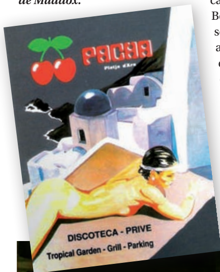
PLATJA D'ARO VIVA

>> Les façanes ben il·luminades de Màrius i Kamel i, a baix, un cartell de Pachà i un aspecte de l'interior de Maddox.