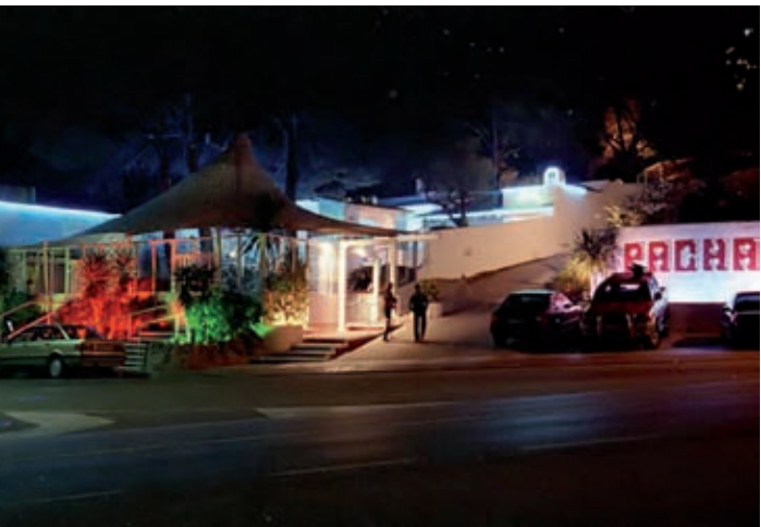
PLATJA D'ARO VIVA