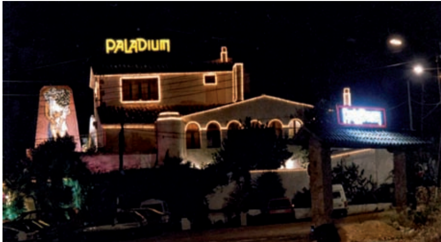
PLATJA D'ARO VIVA

dat com a document gràfic imprescindible de la discoteca i les seves trepidants gogos.