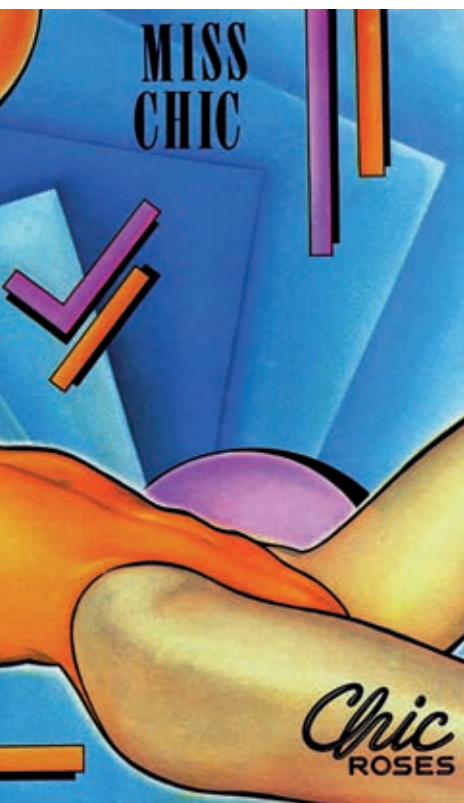
>> «Miss Chic», cartell d'Enric Bug (1981).