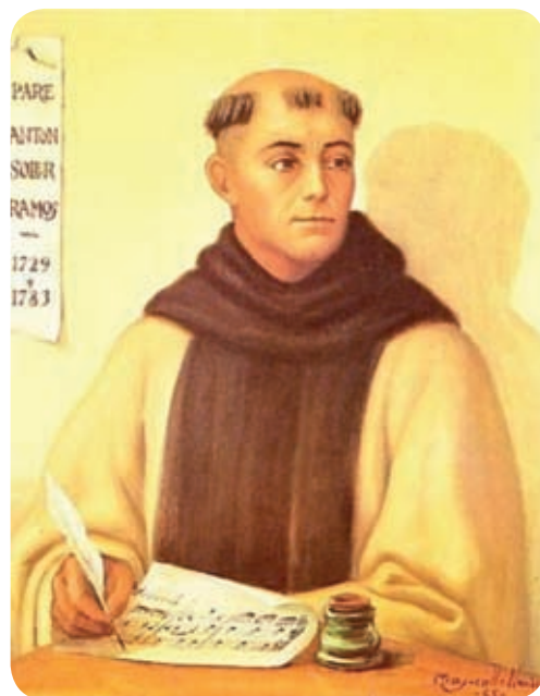
>> Retrat apòcrif del Pare Antoni Soler i Ramos.

Olotí de naixement, va ser batejat el 3 de desembre de 1729. El seu pare, natural de Porrera (el Priorat), formava part de la banda musical del Regiment de Dragons de Numància