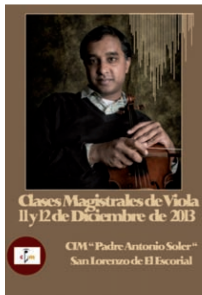
>> Classes magistrals de viola al CIM «Padre Antonio Soler» per part del violista cingalès Ashan Pillai.

Hi ha una dualitat no resolta entre la imatge devota i sacrificada del monjo i el caràcter més frívol, interessat i terrenal del geni