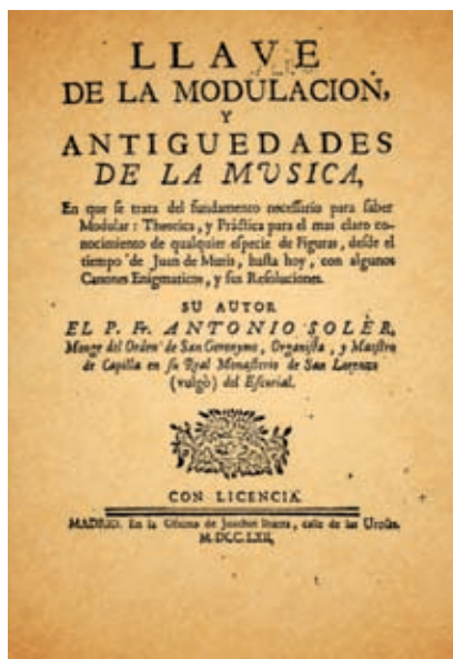
>> Portada del tractat Llave de la Modulación y Antigüedades de la Música .

Tampoc no queda demostrat que Soler s'encarregués de l'educació musical de l'infant Gabriel de Borbó, a qui va dedicar una part important de les seves composicions. Malgrat que en les Memorias sepulcrales figura que va donar lliçons de clavecí a l'infant, estudis recents semblen corroborar que entre el músic olotí i el fill de Carles III hi va haver una relació estreta però informal, en la qual el Borbó encarregaria partitures a Soler i interpretacions privades a canvi de generosos estipendis.