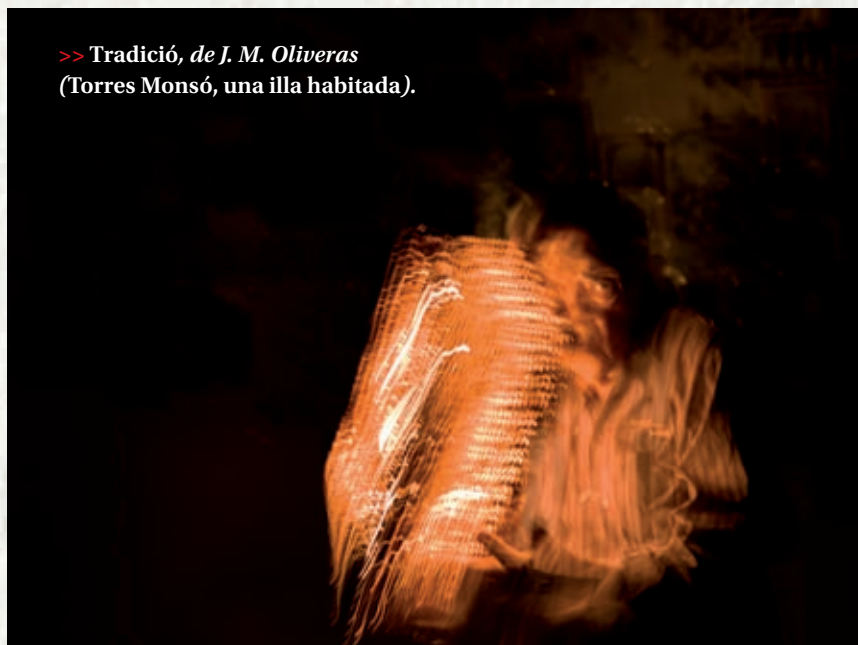
>> Tradició , de J. M. Oliveras ( Torres Monsó, una illa habitada ).

Aquesta relació em va portar a un interès per estudiar l'evolució de la trajectòria artística de Torres Monsó, des dels inicis fins al moment que vàrem començar a col·laborar. Una mirada acadèmica, objectiva, que recollís la documentació dispersa, les seves opinions i que ordenés el procés de transformació del seu llenguatge artístic. Va ser des de l'inici del projecte una voluntat de dissenyar una aproximació diferent a la que havíem mantingut