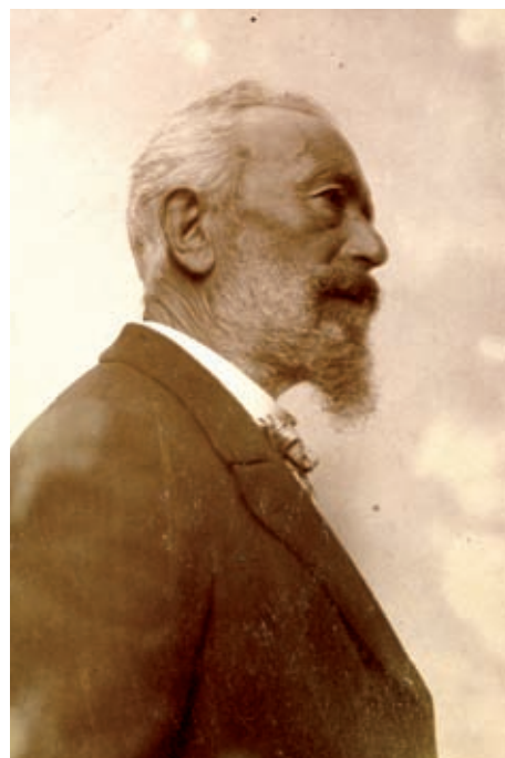
ARXIU COMARCAL DE LA GARROTXA, SERVEI D'IMATGES; FONTS: JOSEP M. MELCÍO PUJOL, AUTOR; DISCONTEJUT

E s centenaris són un bon pretext per fer balanç d'uns fets o d'unes persones que ara es poden mirar amb una certa perspectiva, i per tant la valoració pot ser més objectiva que en èpoques anteriors. Això és el que es pretén amb aquest dossier, en què es repassa la vida i l'obra d'un dels pintors catalans més significatius de l'inici del paisatgisme català, sorgit a partir de la irradiació d'una nova manera de veure els entorns, i que es va iniciar a Barbizon. El grup francès va propiciar l'aparició d'escoles paisatgístiques en diverses nacions europees, i Berga va tenir un paper fonamental en la vertebració de l'Escola d'Olot, el moviment que ha estat un dels principals pilars del realisme pictòric a casa nostra. Va ser un pleinairista quan ningú del seu entorn ho practicava. Va començar a pintar temàtiques que després s'han imitat i generalitzat mimèticament. La seva paleta és d'una riquesa