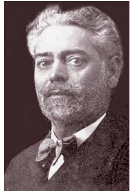
ARXIU ROO 1978

La nombrosa clientela trobaven en ell el metge amb un profund bagatge científic, un bon ull clínic i un humanisme il·limitat