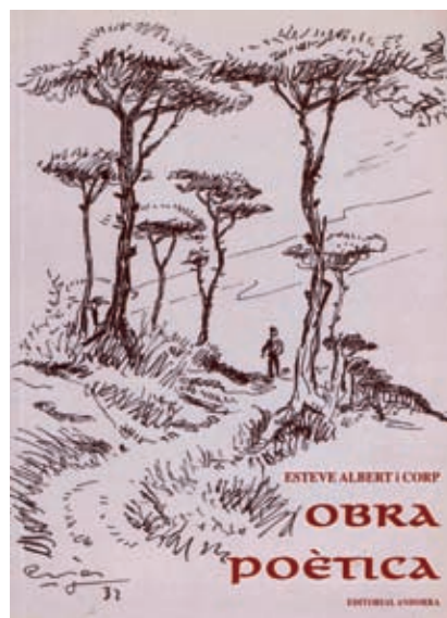
>> Portada del llibre Obra Poètica , d'Esteve Albert, Editorial Andorra, 2004.

Coneixedor com cap altre dels passos del Pirineu, entrant i sortint com si fos casa seva, sempre amagant-se de la