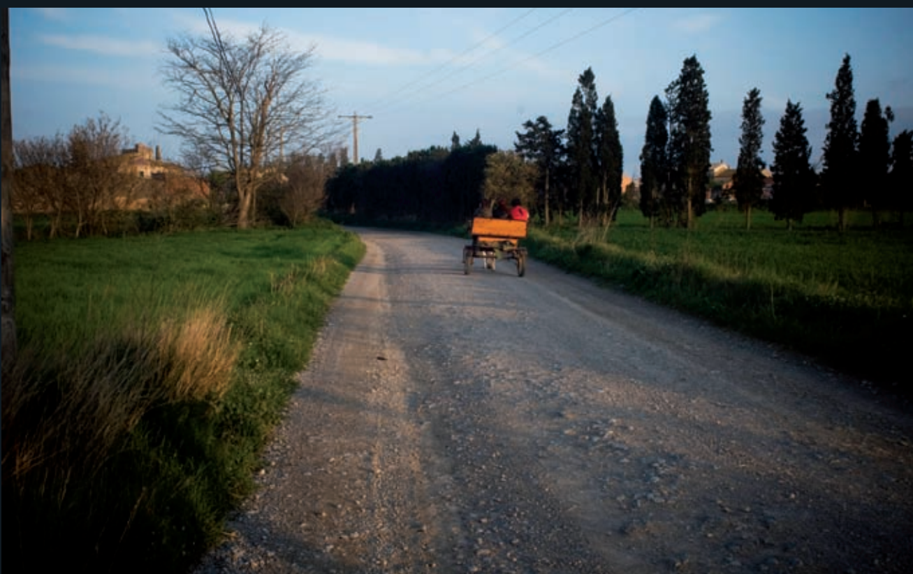
>> «Hi va tornar a créixer l'herba, ufanosa, com mai, des del rec fins al camí dels tamarius». Les Closes (1984). Lloc: Vilamacolum (Alt Empordà).