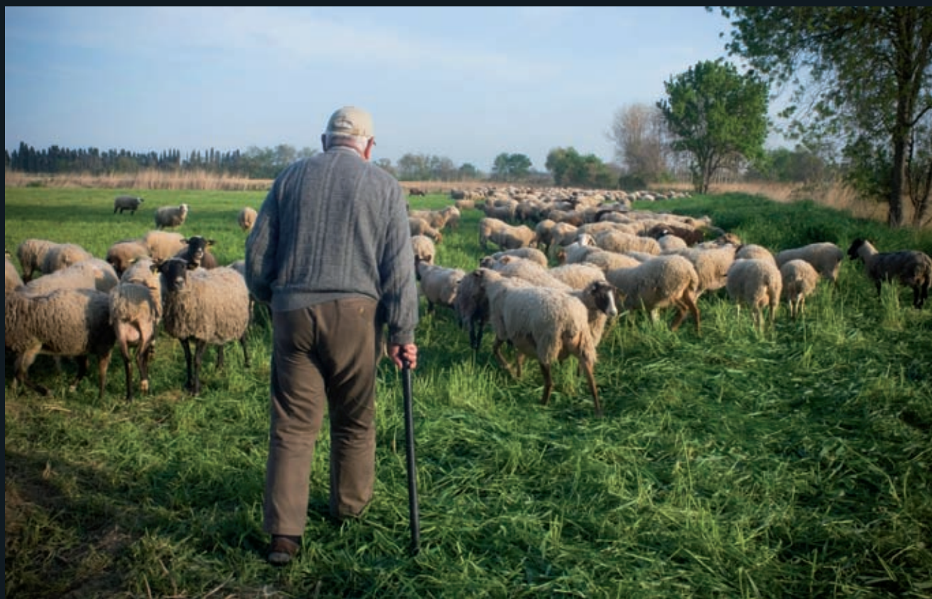
>> «Les terres de Vilasirvent són molt bones, llevat dels aspres, i vostè coneix prou bé les collites de blat, blat de moro, mestall, civades i faves que lleven». Les Closes (1984). Lloc: Vilamacolum (Alt Empordà).