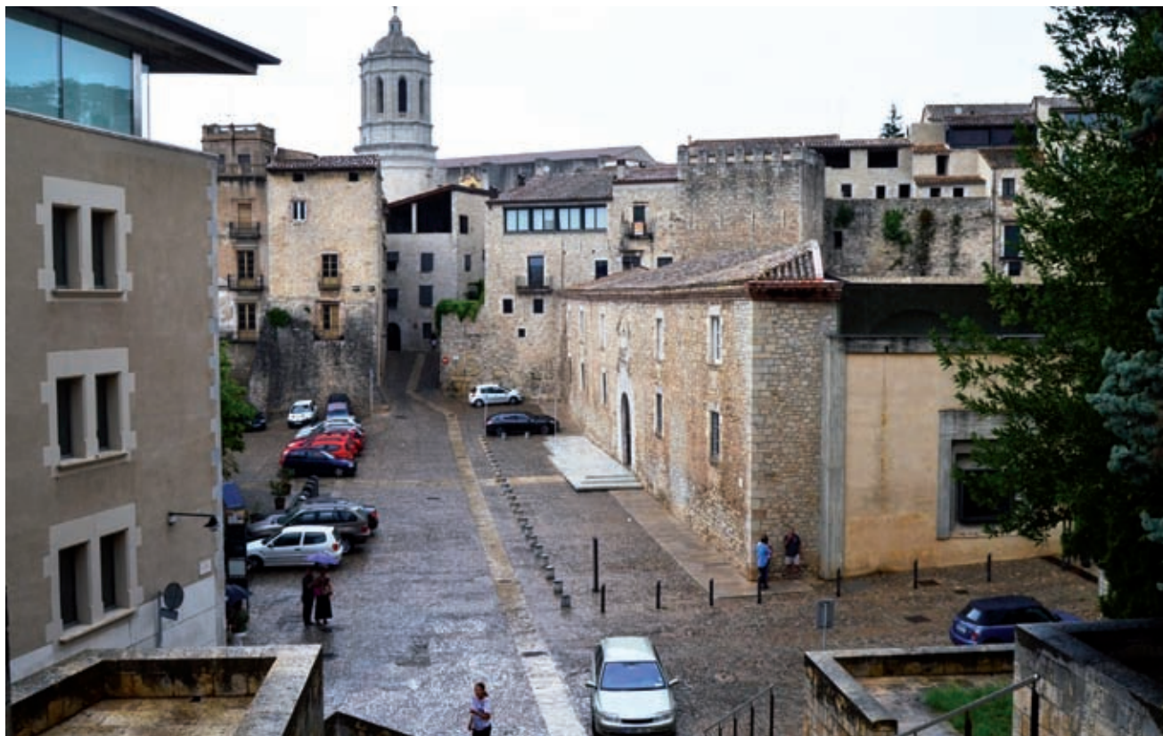
>> Edifici Les Àligues, seu de la Universitat de Girona, a la plaça Sant Domènec.

A ls joves nascuts entre els anys vuitanta i noranta se'ls coneixia amb el nom de «generació Y». A diferència dels seus pares, havien crescut en una època d'oportunitats laborals i d'abundància econòmica. Amb l'inici de la crisi, el 2008, les expectatives s'han estrocat per a molts d'ells, que tenen dificultats per trobar una feina digna i per emancipar-se. El 2012 l'Organització Internacional del Treball (OIT) ja va referir-se als joves espanyols i grecs com la «generació perduda», la qual no té res a veure amb la dels joves escriptors nord-americans instal·lats a París als anys vint del segle xx i que Gertrude Stein va batejar amb aquesta expressió.