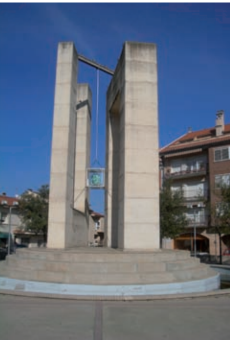
>> Sant Hilari Sacalm. Monument a Josep Moragues, de Domènec Fita (1991).