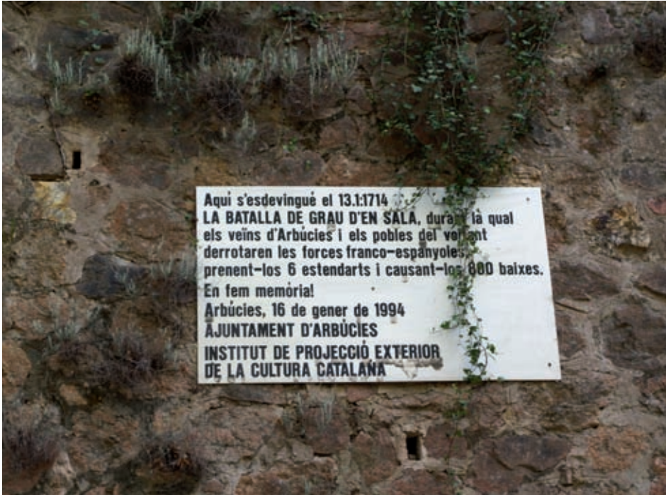
>> Placa commemorativa de la batalla de Grau d'en Sala, a Arbúcies.