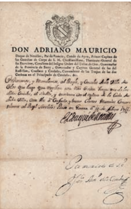
>> Carta del duc de Noailles en la qual s'exigia que una representació de l'ajuntament olotí l'anés a veure a Girona (10 de febrer de 1711).