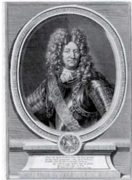
>> Anne Jules de Noailles, (1650-1708) fou militar i home d'estat del Regne de França.