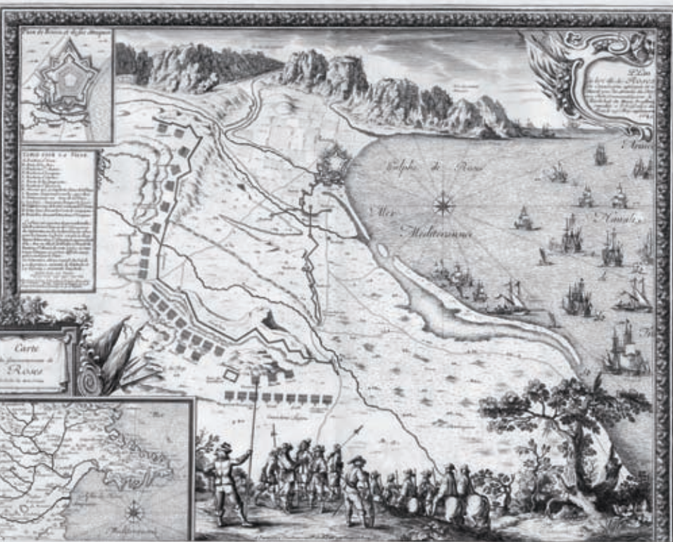
SÉBASTIEN DE PONTAULT - LES GLOIREUSES VICTOIRES DE LOUIS LE GRAND, CA. 1643-1694, VOL. 41