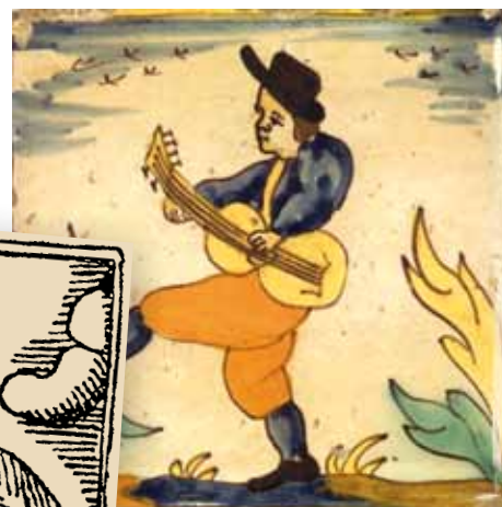
>> Rajola amb un músic guitarrista i, a l'esquerra, la mulassa de Girona.

Al vespre fou el torn de les alimares, que volien convertir la nit en dia amb atxes i lluminària. Van ballar els gegants, la mulassa i l'àliga i gitaren coets la mulassa i els dracs. Dalt de cadafals, quatre cobles van sonar la «Lloança a les glòries de Carlos III».