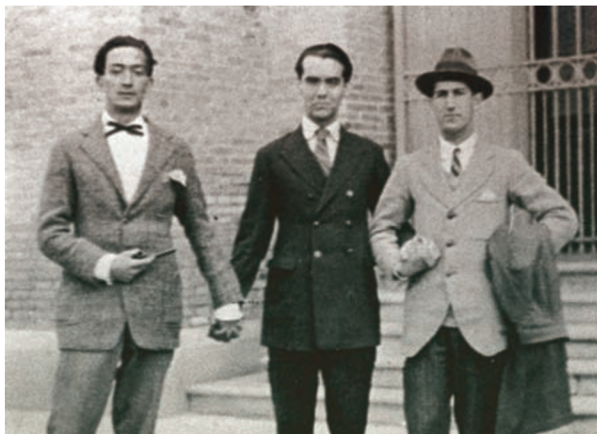
ARJÚ PERE VEHÍ

Quan, el 1931, Salvador Dalí pintava La persistència de la memòria —aquell quadre que tots coneixem com Els rellotges tous — ja sabia que la seva personalitat (humana i artística) romandria intacta en un hiperpresent continu i amb un interès idèntic al cap de vint-i-cinc anys de la seva mort. Que la seva obra pictòrica és d'una vigència radical, no en tenim cap mena de dubte: només cal anar un dia qualsevol al Teatre-Museu Dalí de Figueres. Dalí serà sempre Dalí, l'únic i d'interès universal. Però afortunadament es comença a reivindicar amb la força que es mereix la seva faceta com a escriptor. No ens ho inventem: ell mateix ja ho va deixar ben clar quan va dir allò de «sóc més bon escriptor que pintor», i el seu amic García Lorca ja va augurar la missió literària al pintor en diverses ocasions. En homenatge a aquest quart de segle sense la seva presència física, han aparegut diversos llibres que volen obrir el personatge cap al terreny del pensament, la filosofia i l'escriptura. No parlem d'una afició menor. El llegat de quasi nou mil pàgines escrites per l'autor de la novel·la Rostres ocults és una mostra de la seva «llibertat mental extraordinària», en paraules de Josep Pla, i és, per damunt