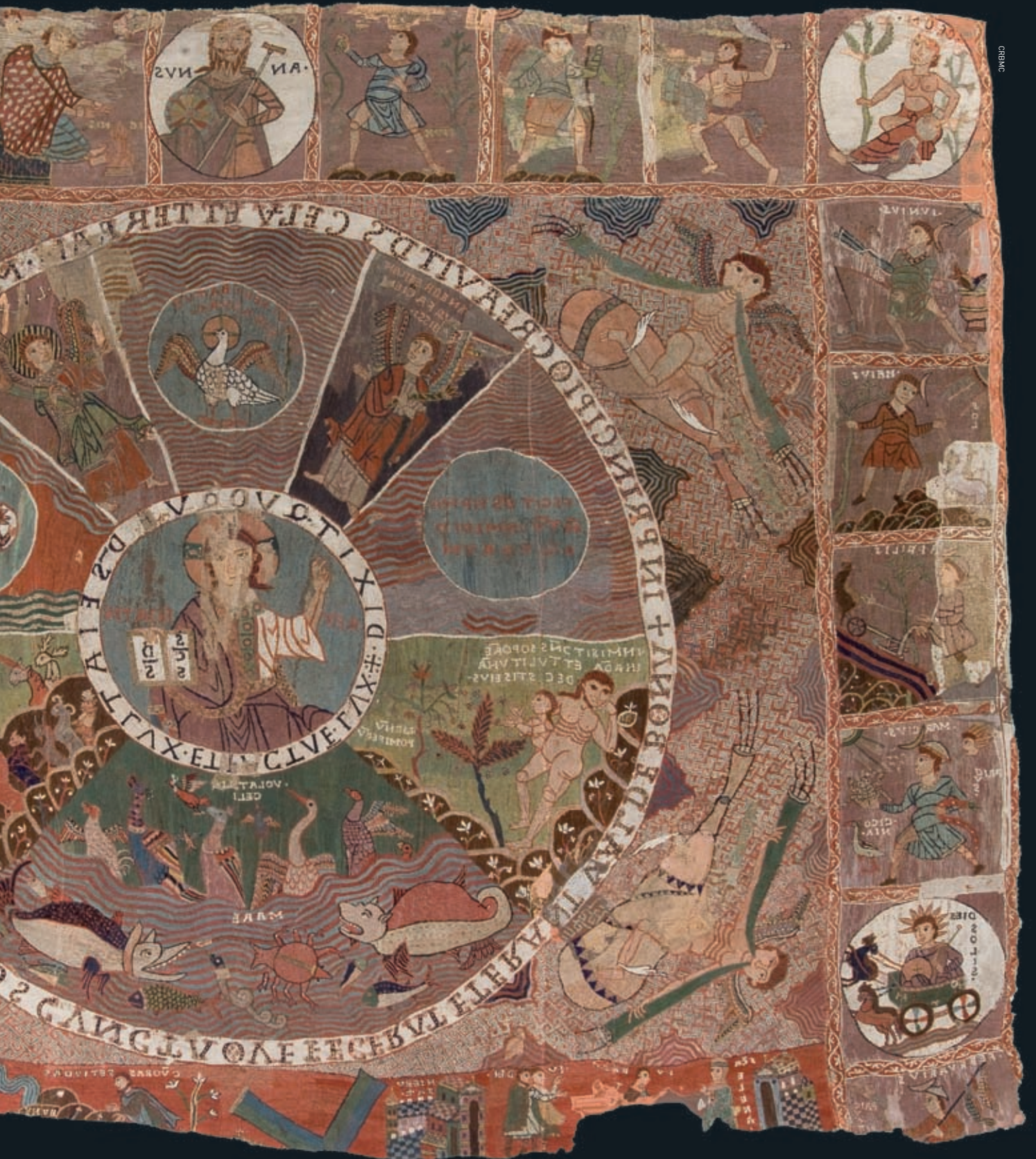
Destaca principalment la vestimenta del Crist Creador, de color porpra. És un color allunyat del to verdós que podem contemplar en la seva exposició, i correspon a la màxima autoritat. Revers.