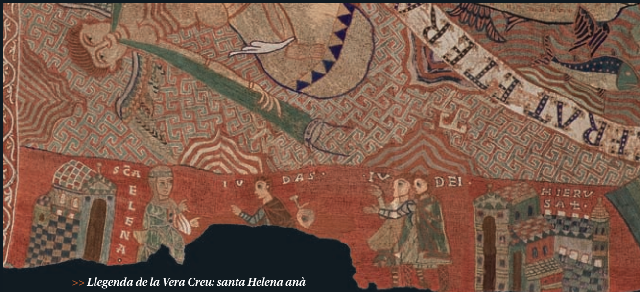
>> Llegendes de la Vera Creu: santa Helena anà a Jerusalem i demanà als jueus on era la creu de Crist...

EDDY KELELE - CAPÍTOL CATEDRAL DE GIRONA