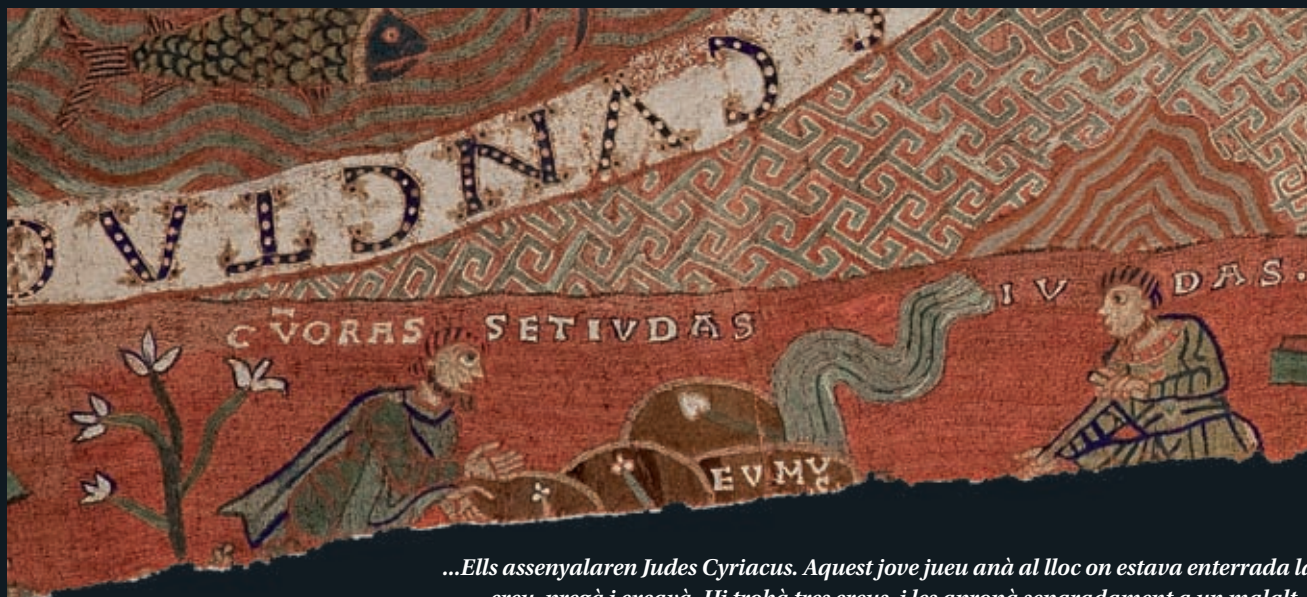
...Els assenyalaren Judes Cyriacus. Aquest jove jueu anà al lloc on estava enterrada la creu, pregà i excavà. Hi trobà tres creus, i les apropà separadament a un malalt...

EDDY KELELE - CAPÍTOL CATEDRAL DE GIRONA