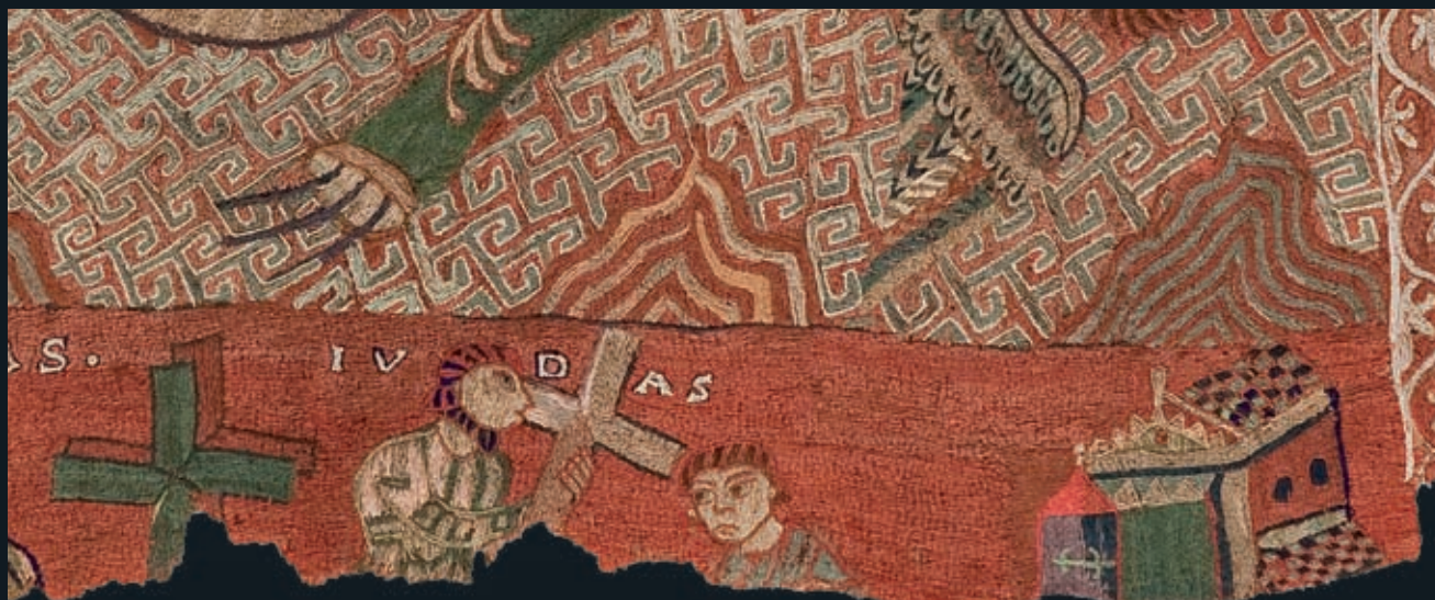
No es conserva en el Tapís, però la llegenda continua amb Judes quan entrega la creu de Crist a santa Helena. Anvers.

EDDY KELELE - CAPÍTOL CATEDRAL DE GIRONA