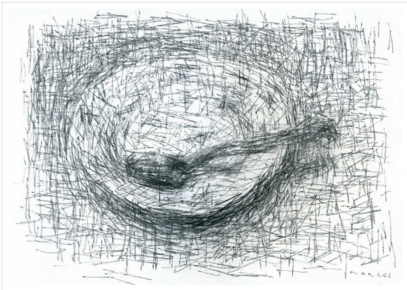
Cullera (2009), llapis carbó sobre paper, 21x30 cm.

Recorda que sempre li havien dit que sabia dibuixar, i de fet era l'única matèria que li interessava de l'escola. El dibuix el fascinava. Ja llavors deia que quan fos gran volia ser dibuixant. Tot i ser adolescent, la seva determinació era tan ferma que els seus pares als dotze anys el van apuntar a un Curso de Dibujante General de la CEAC, una editorial especialitzada a donar coneixements i títols per correspondència. Aquella determinació va ser modificada amb els pas dels anys malgrat que mai no ha deixat de dibuixar. Molts dels treballs fotogràfics sovint eren concebuts a partir del dibuix, però eren usos laterals, marginals, d'aquesta disciplina. No ha estat fins fa pocs anys –a partir del 2008– que va decidir reprendre el dibuix com a activitat central de la seva vida. No recorda haver practicat mai cap activitat d'una manera tan intensa i continuada. Diu que no sols és el seu darrer treball, al qual dedica moltes hores diàries, sinó que assegura que serà el darrer