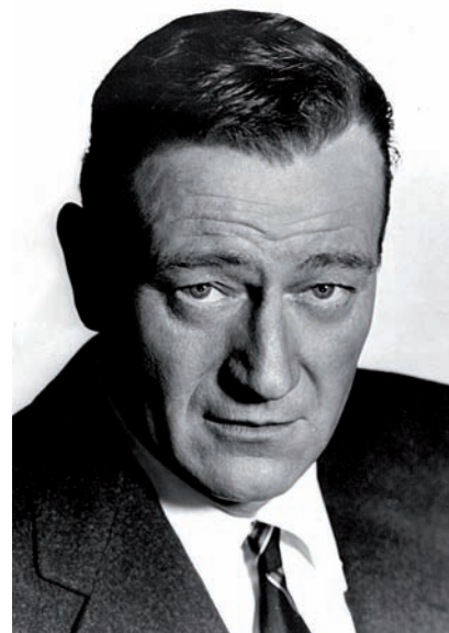
>> John Wayne va barquejar per la Costa Brava mentre rodava a Barcelona. El fabuloso mundo del circo, l'any 1963.

A John Wayne li agradava molt més navegar que cavalcar i, efectivament, va navegar per la Costa Brava