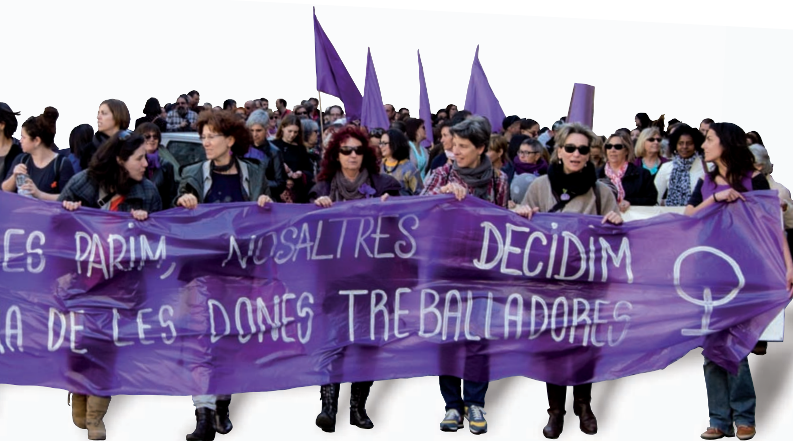
>> Manifestació a Girona del Dia de la Dona convocada sota el lema «Nosaltres parim, nosaltres decidim».

des entremaliades, que sortien de nit i feien la bugada al riu Ter.