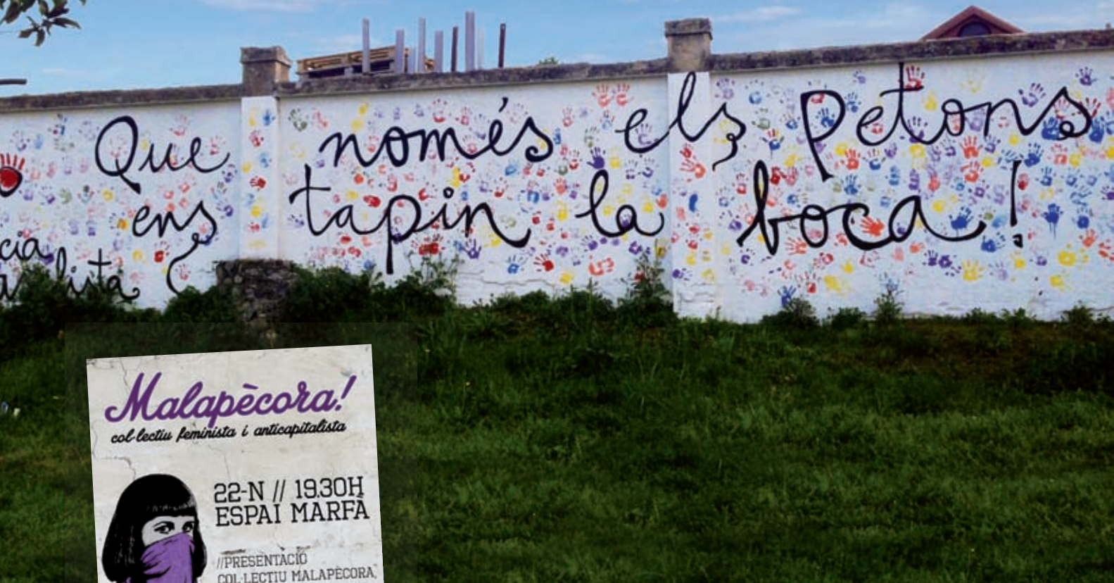
>> Mural de les Goges de Celrà. A l'esquerra, diversos cartells dels col·lectius feministes.

part de Joves per l'Alliberament Gai, una escissió del Front d'Alliberament Gai de Catalunya. Malgrat això, Brot Bord no lluita simplement per l'alliberament gai, sinó que pretén lluitar contra el patriarcat, l'homofòbia i la transfòbia. Brot Bord té assemblees a Girona, Barcelona, Tarragona, València i al Baix Llobregat, i és un col·lectiu proper a l'Esquerra Independentista.