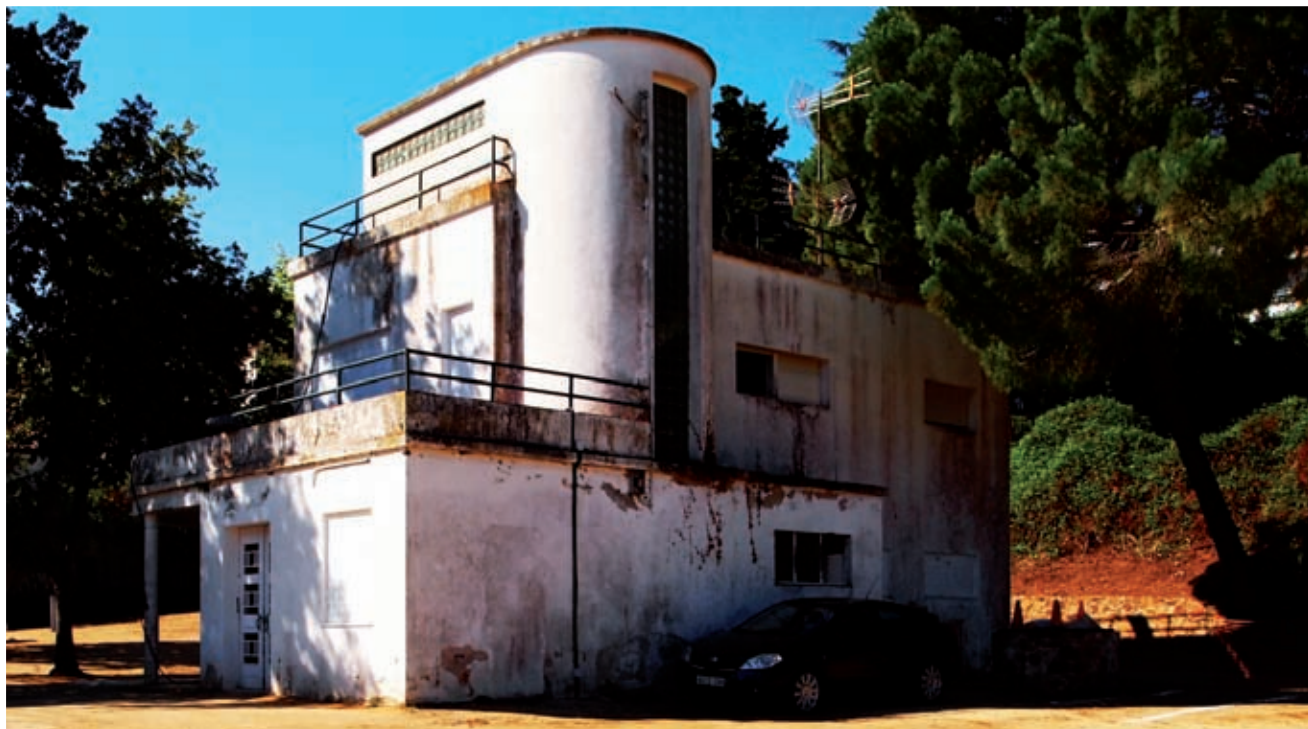
>> Casa Acerbi (agost de 2013).

La Bauhaus va ser una escola d'art, arquitectura i disseny que es va convertir, entre d'altres disciplines, en una fàbrica d'arquitectes anomenats primers racionalistes. La seva arquitectura es caracteritzava per l'absència d'ornamentació i l'harmonia entre la funció i els mitjans artístics i tècnics. Otto Boelitz va rebre les seves influències culturals i arquitectòniques. Un clar exemple n'és la Casa Fieger (1927), a Dessau. És extraordinària la semblança que té amb la Casa Acerbi.